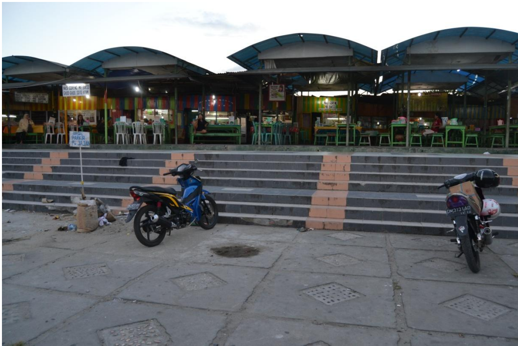
Gambar 1.1 Pasar Jajan Tampak dari depan