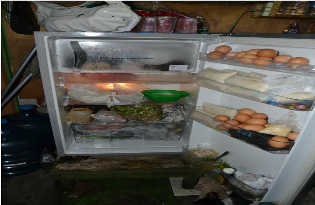
Gambar 1.6 Penyimpanan makanan di kemari es