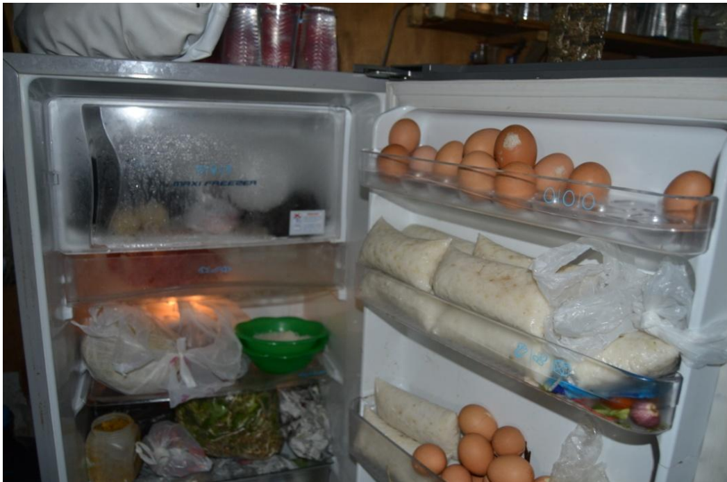
Gambar 1.5 penyimpanan makanan di lemari es