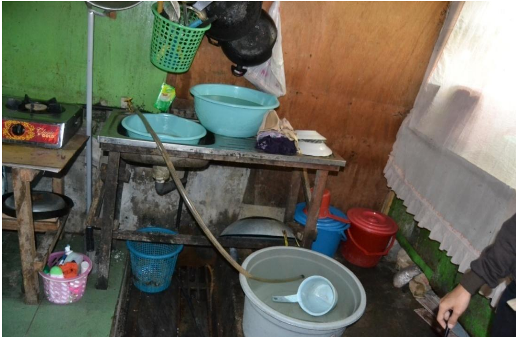
Gambar 1.4 kondisi dapur di pasar Jajan