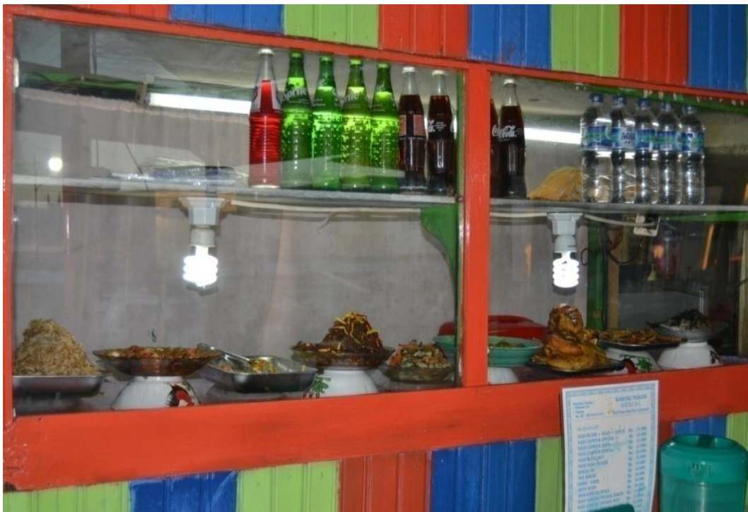
Gambar 1.7 Penyajian Makanan di Pasar Jajan