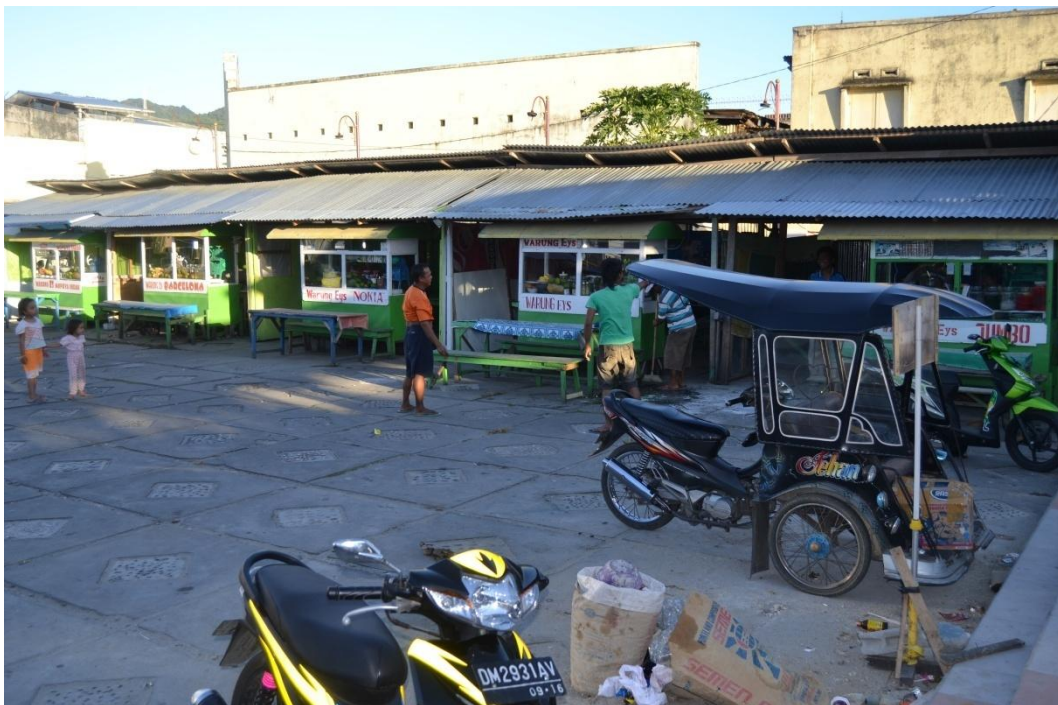
Gambar 1.11 Sampah