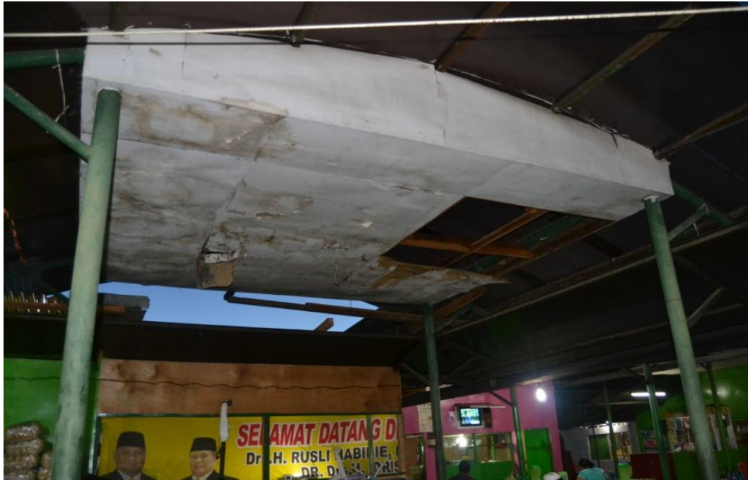
Gambar 1.10 Kondisi plapon pasar Jajan