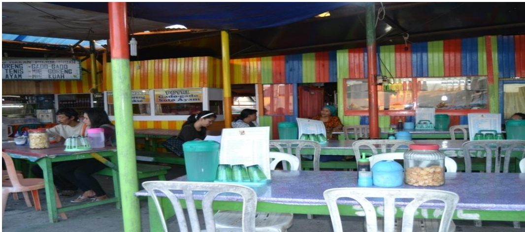
Gambar 1.13 Peneliti berbincang-bincang dengan responden