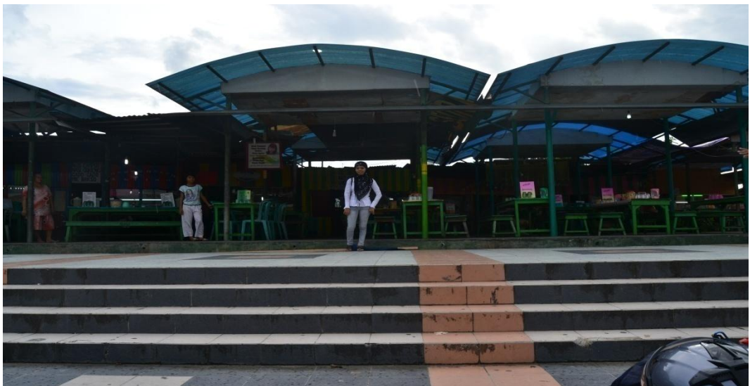
Gambar 1.14 Pasar Jajan tampak dari depan