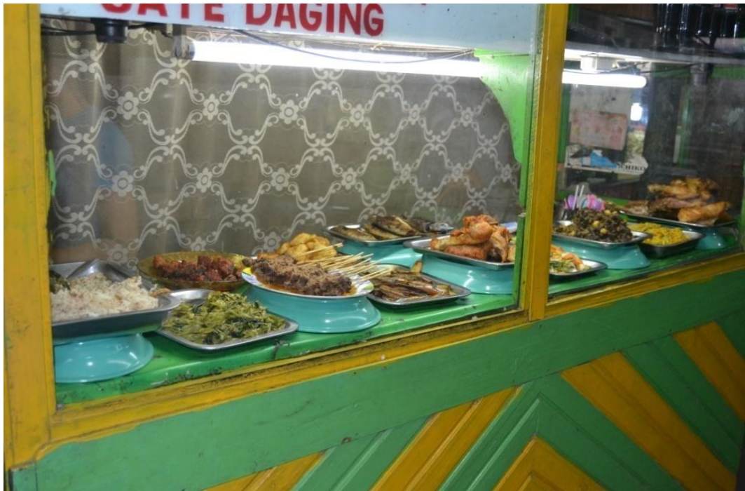
Gambar 1.8 penyajian makanan di pasar Jajan