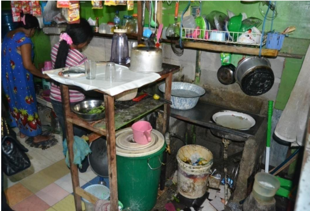
Gambar 1.2 Kondisi dapur di pasar Jajan