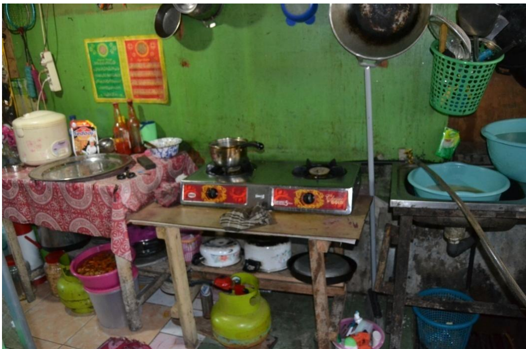
Gambar 1.3 Kondisi dapur di pasar Jajan