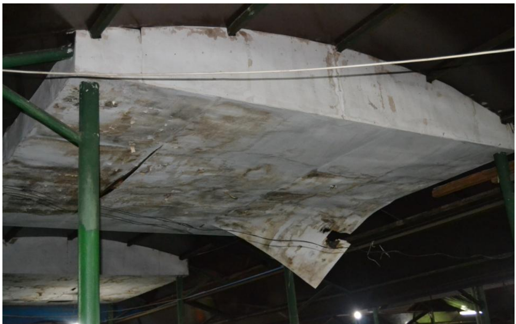
Gambar 1.9 kondisi plapon pasar Jajan