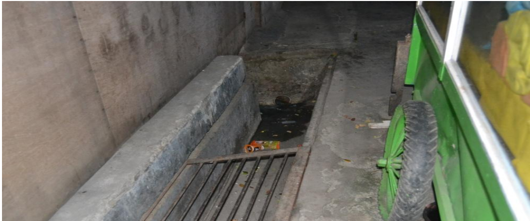
Gambar 1.12 Saluran / got