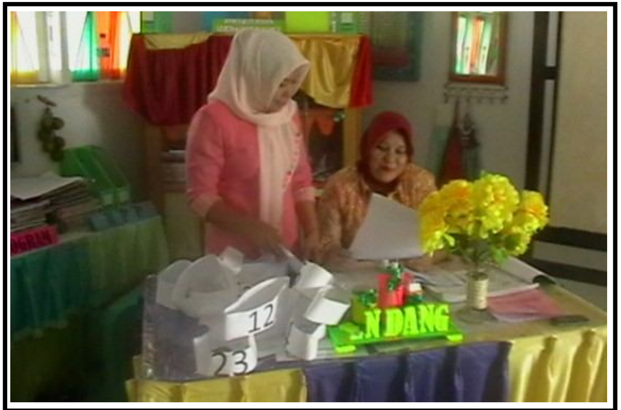
Dokumentasi siklus 2 saat refleksi dengan guru pamong