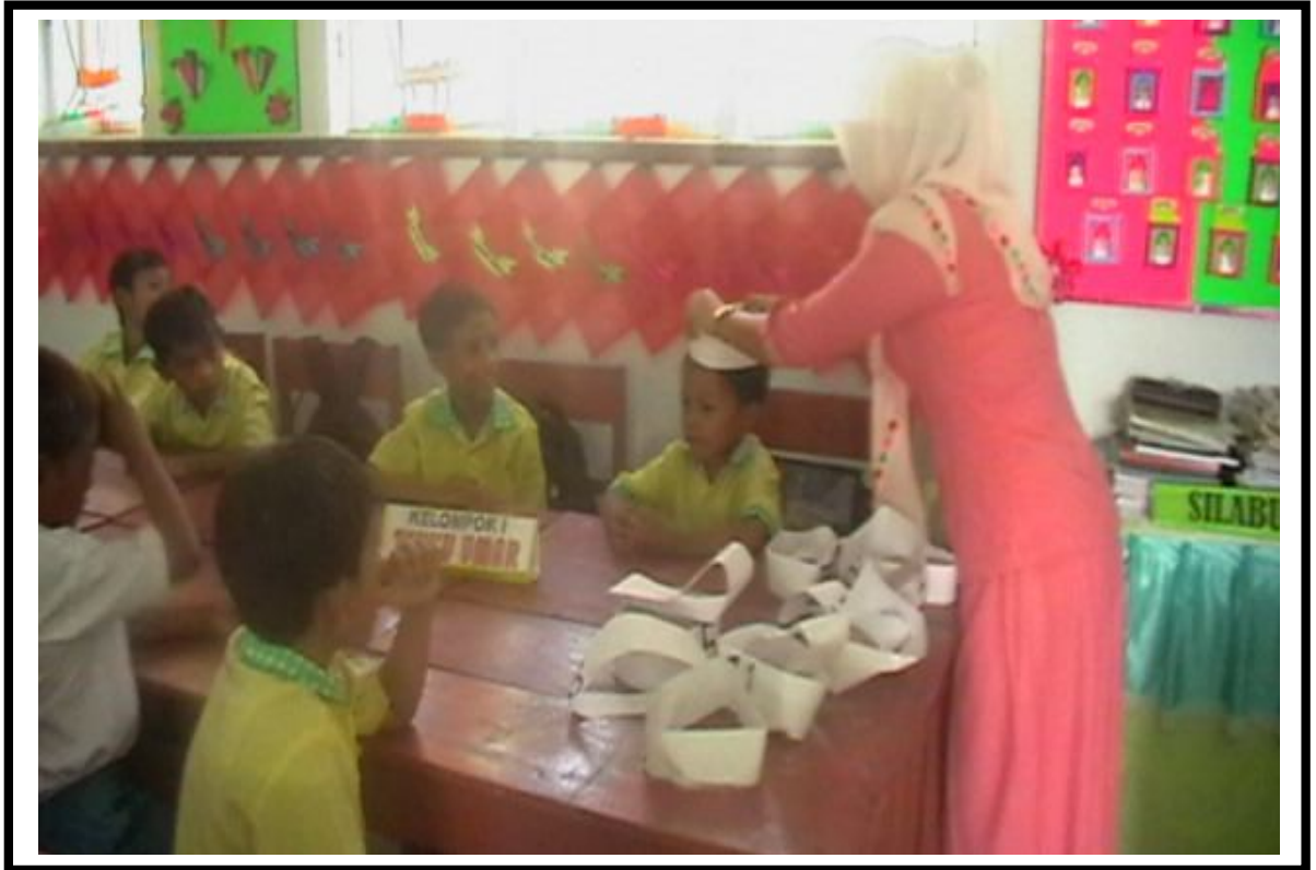
Dokumentasi siklus 2 saat proses pembelajaran dalam membagi nomor