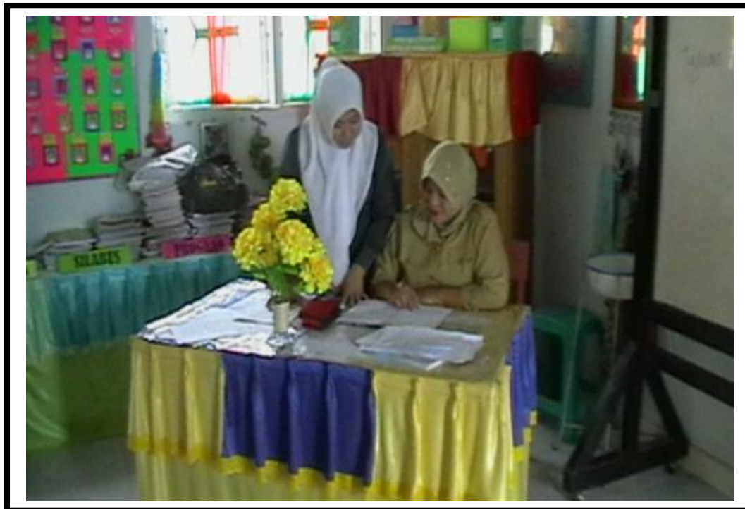
Dokumentasi siklus 1 saat refleksi dengan guru pamong