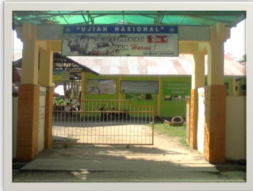
Foto Depan SMP Negeri 1 Paguyaman Kabupaten Boalemo