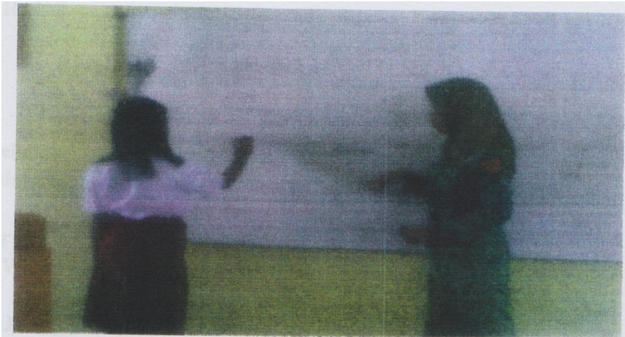
Kegiatan awal apersepsi, guru menggali pengetahuan siswa