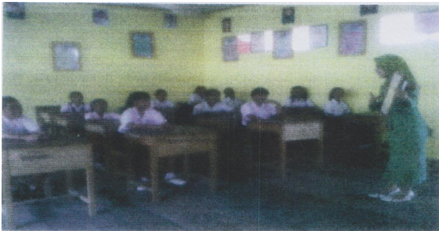
Kegiatan inti guru menjelaskan materi serta interaksi antar guru dan murid