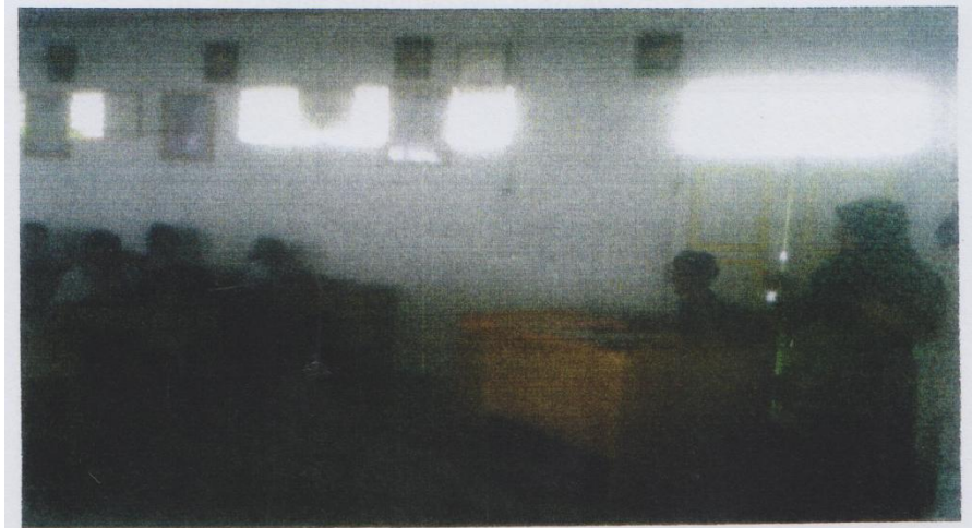
Kegiatan awal apersepsi, guru menggali pengetahuan siswa