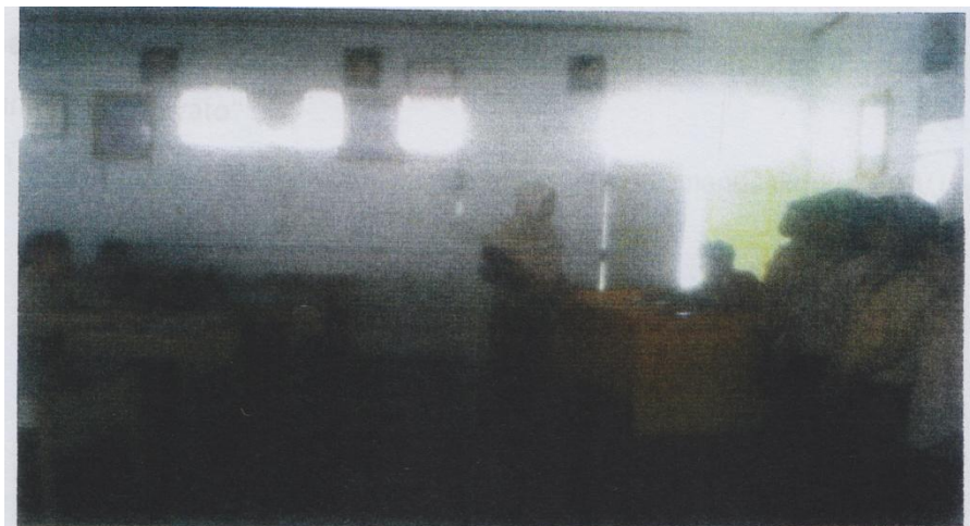
Kegiatan inti guru menjelaskan materi serta interaksi antar guru dan murid