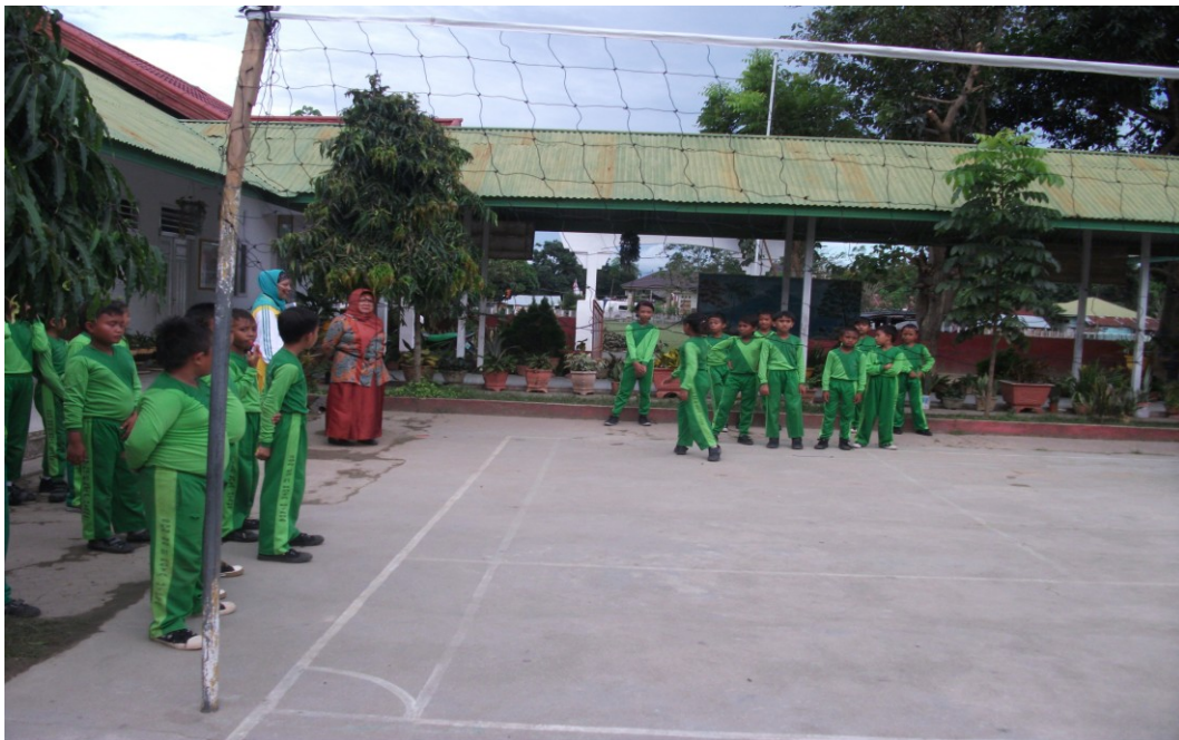
Gambar 1.15 Evaluasi siklus II