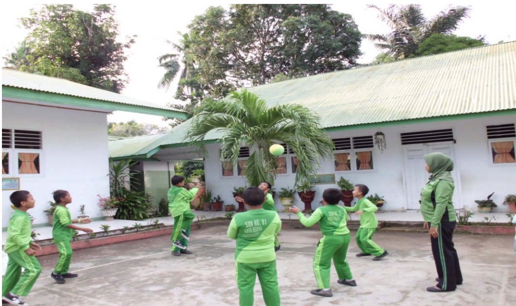
Gambar 1.6 Pemanasan Dinamis