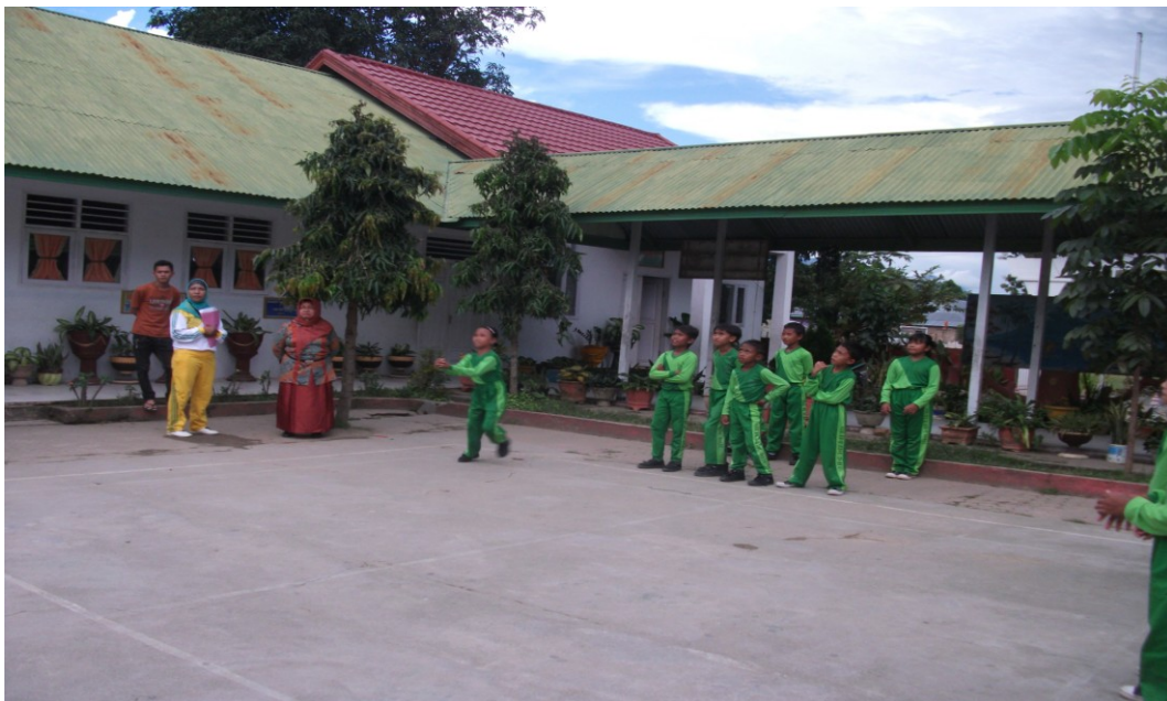
Gambar 1.14 Evaluasi siklus II