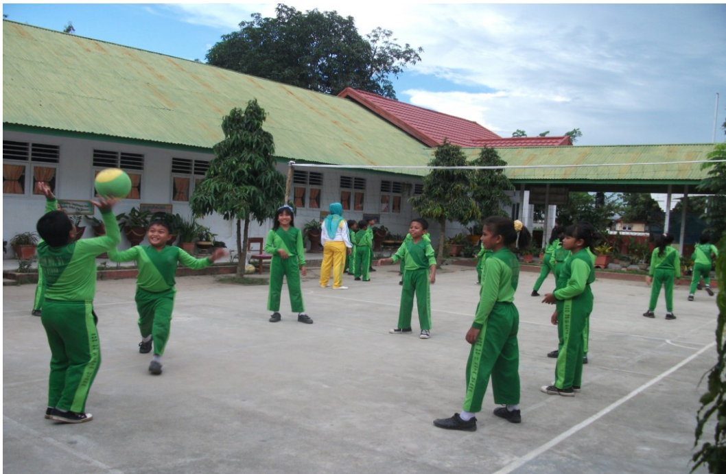
Gambar 1.5 Pemanasan Dinamis