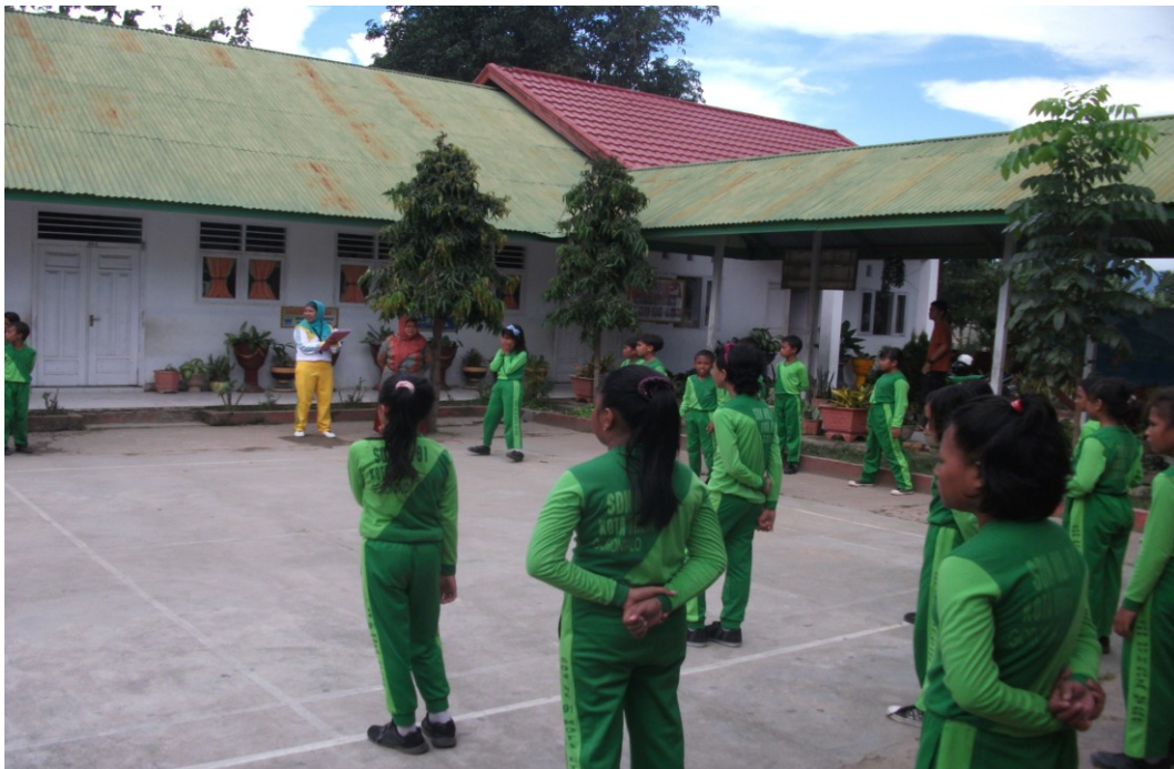
Gambar 1.13 Evaluasi siklus II