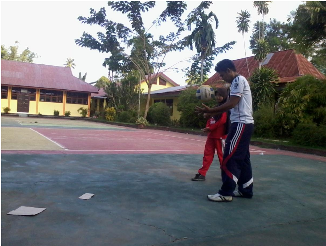
Gambar 5. Mendemonstrasikan Cara Melakukan Servis