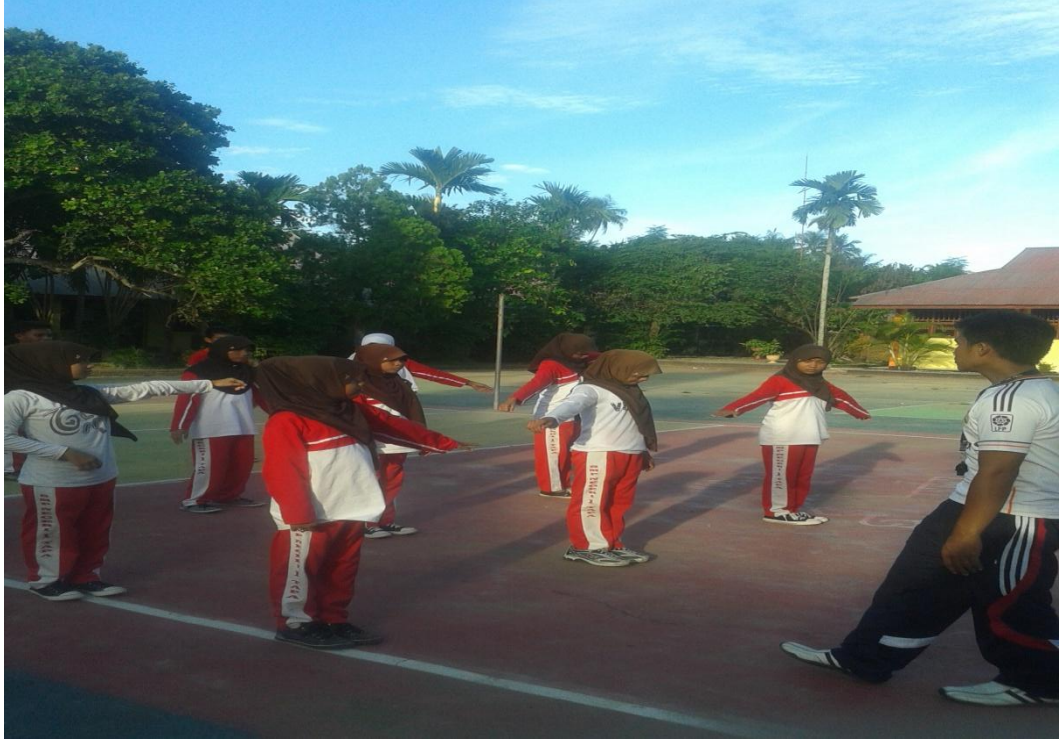
Gambar 1. Formasi Barisan