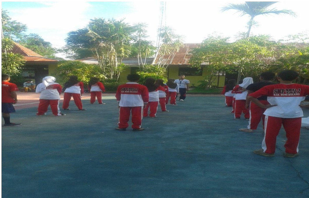
Gambar 4. Pemberian Materi