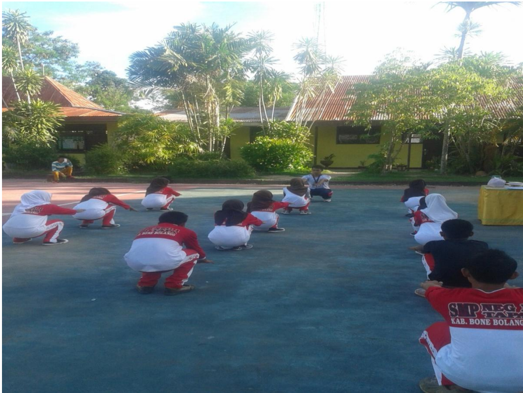
Gambar 3. Pemanasan Dinamis