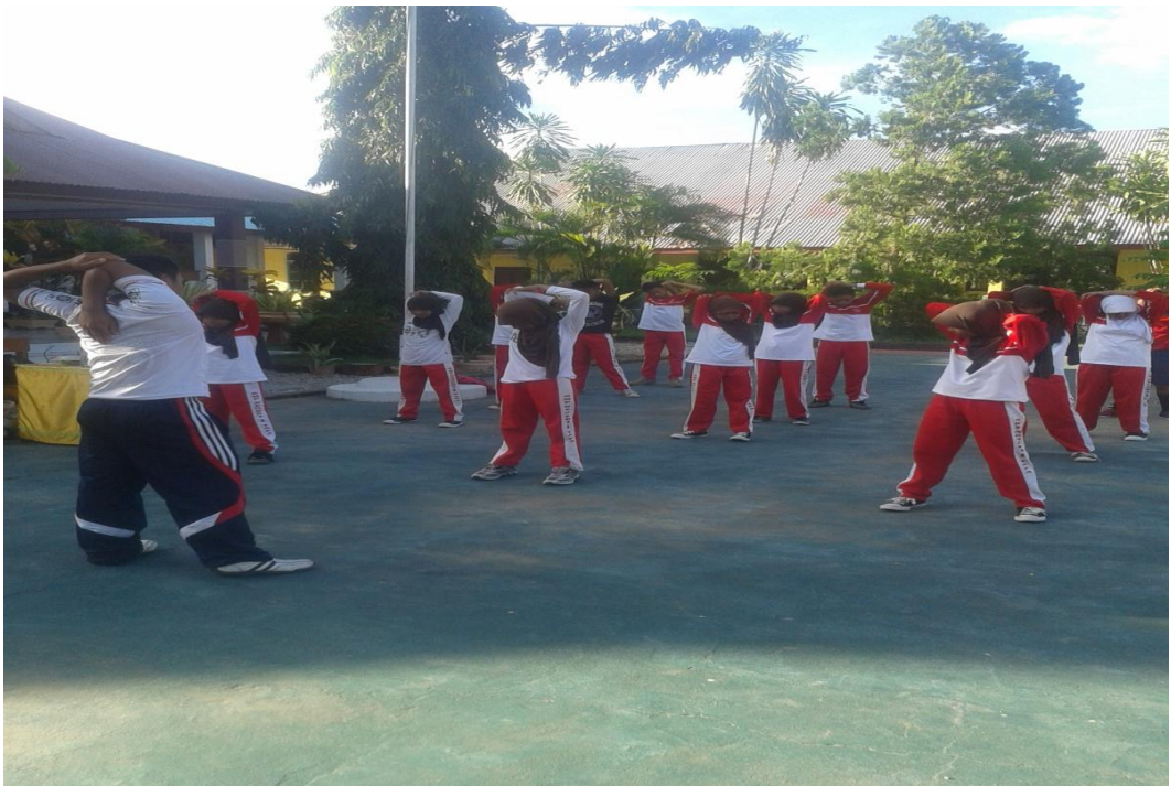
Gambar 2. Pemanasan Statis