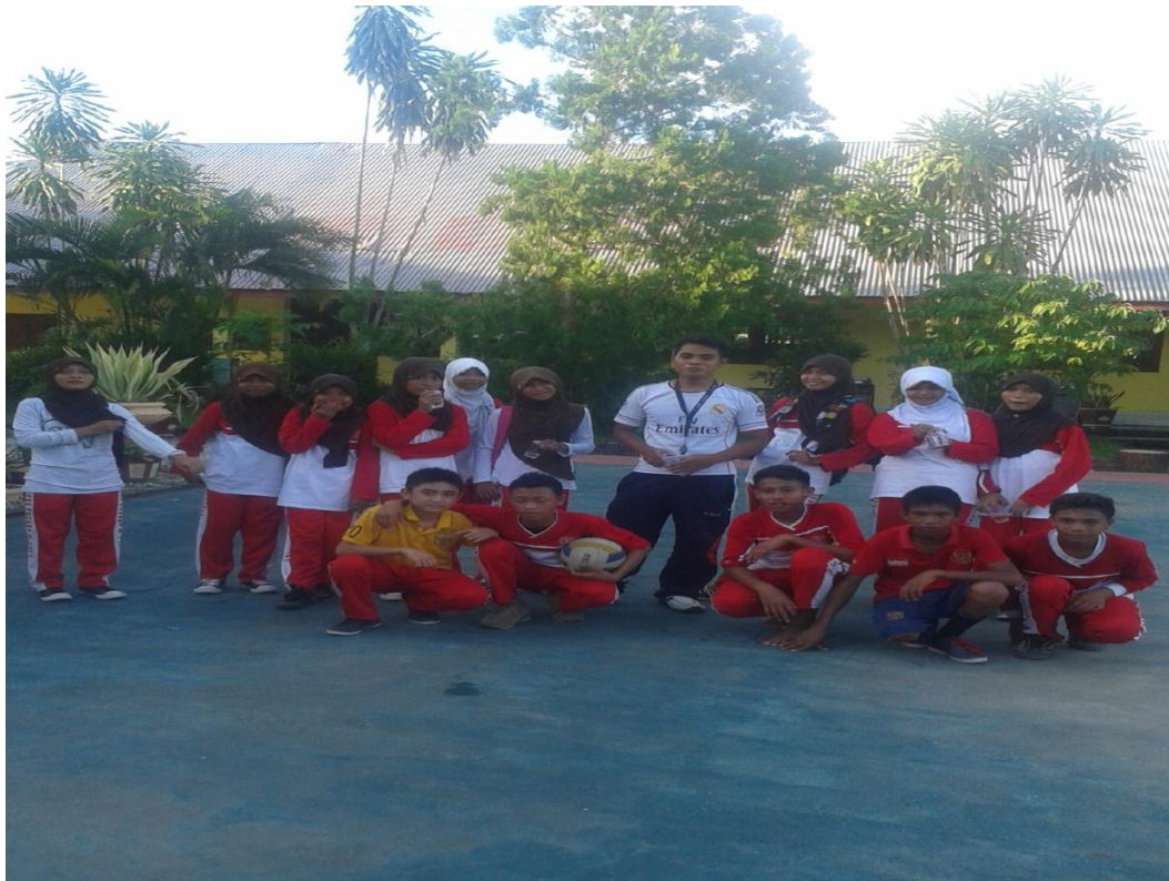
Gambar 8. Foto Bersama Siswa