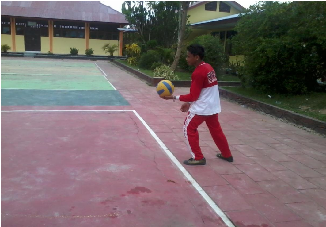
Gambar 7. Saat Melakukan Servis Bawah