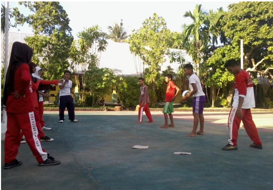
Gambar 6. Saat Melakukan Servis Bawah Secara Berpasangan