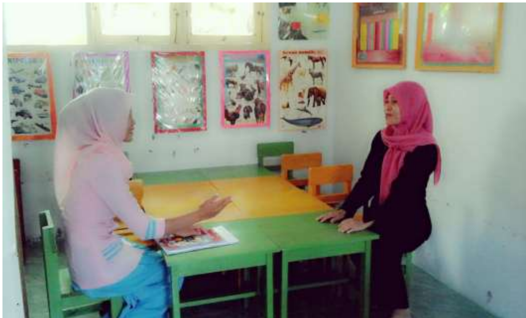
Gambar 2. wawancara bersama guru kelompok B