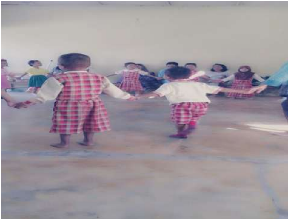
Gambar 3. Anak berani tampil dan percaya diri