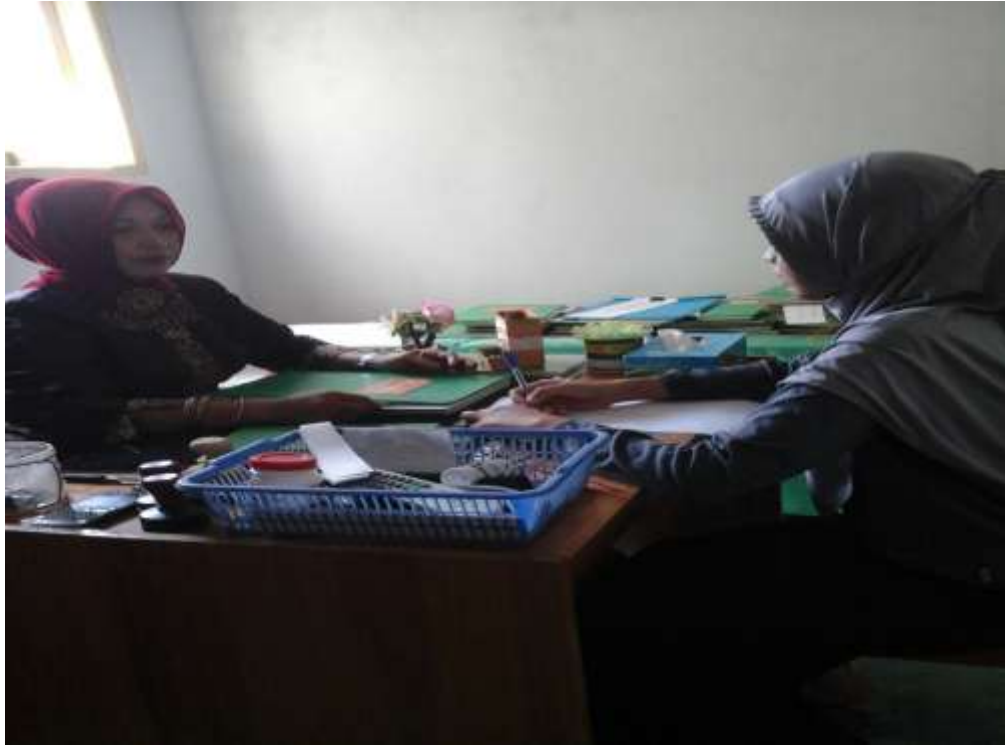
Gambar 1. wawancara bersama kepala sekolah