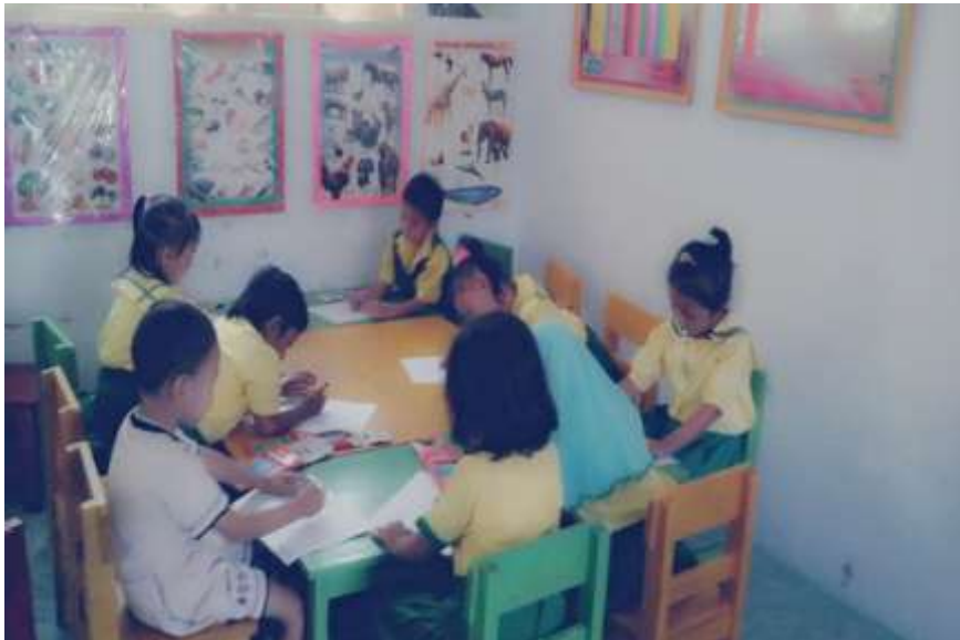
Gambar 6. Anak mandiri dalam mengerjakan tugas