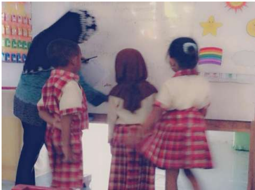
Gambar 8. Guru memotivasi anak dengan meminta anak menulis nama sendiri di dalam bintang