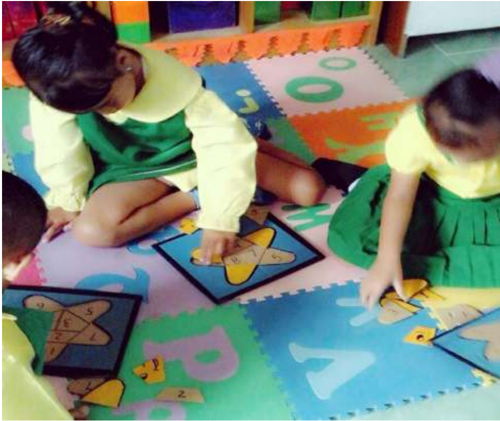
Gambar 5. Anak mandiri dalam mengerjakan tugas