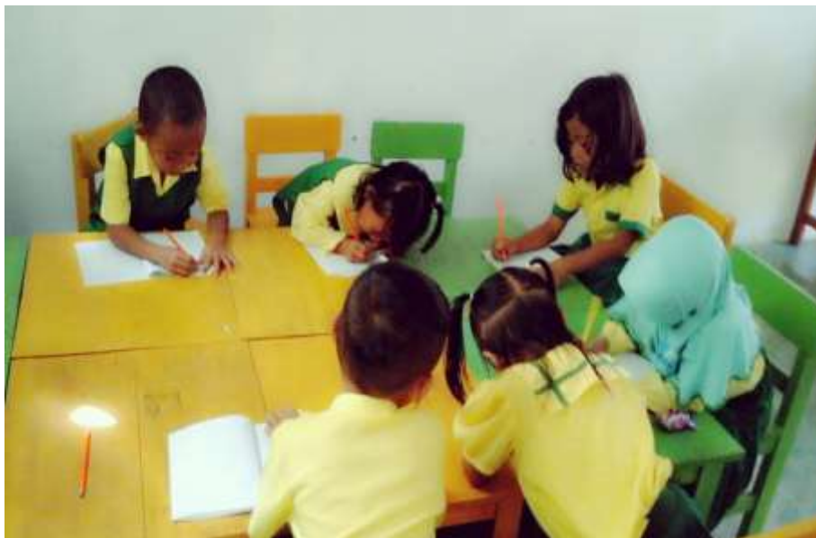
Gambar 12. Anak masih suka meniru hasil pekerjaan temannya