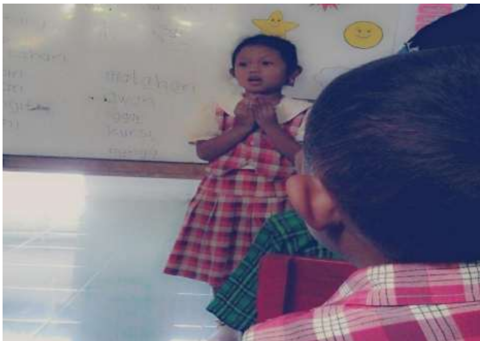
Gambar 4. Anak berani tampil dan percaya diri