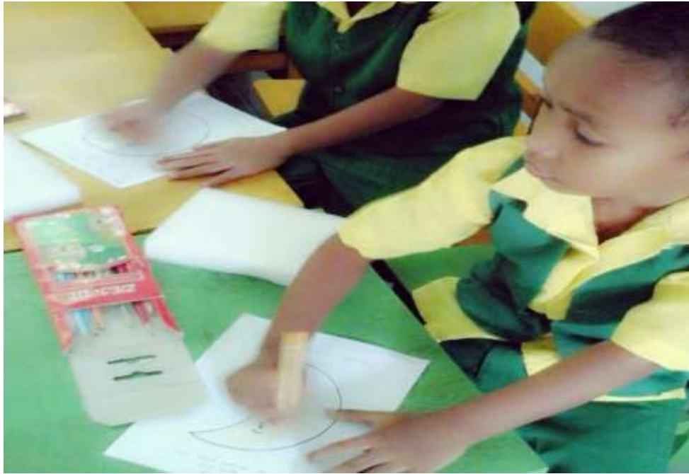
Gambar 9. Anak memiliki motivasi dalam belajar