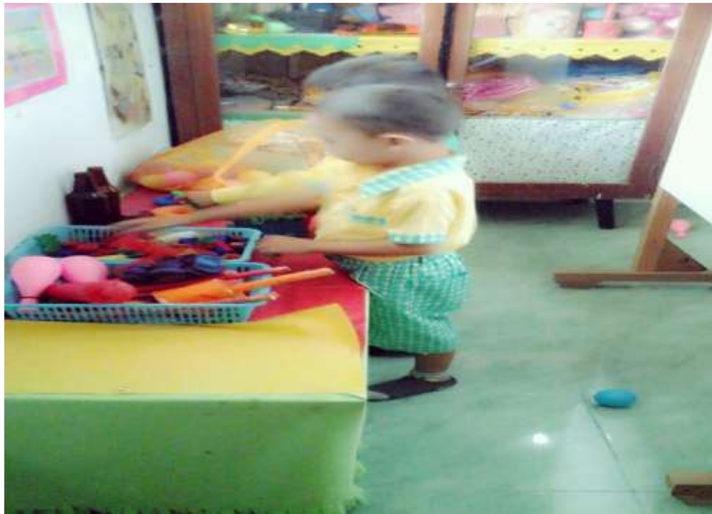
Gambar 10. Anak bertanggung jawab mengembalikan mainan pada tempatnya