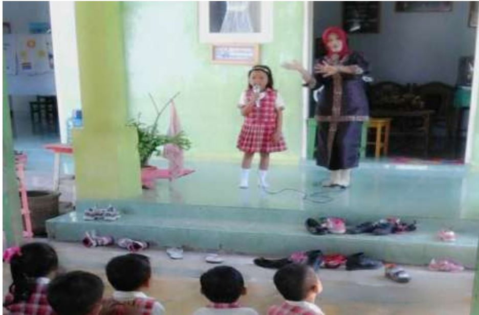
Gambar 7. Guru memotivasi anak untuk berani tampil