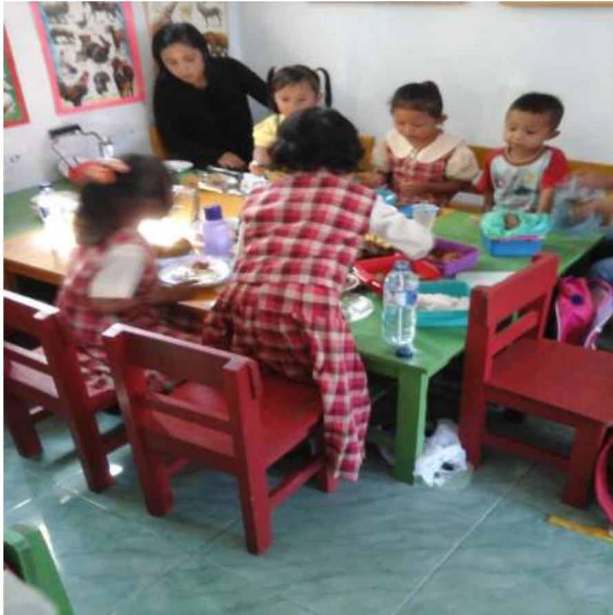
Gambar 11. Sebagian anak bisa makan sendiri sebagian masih ditemani orang tua