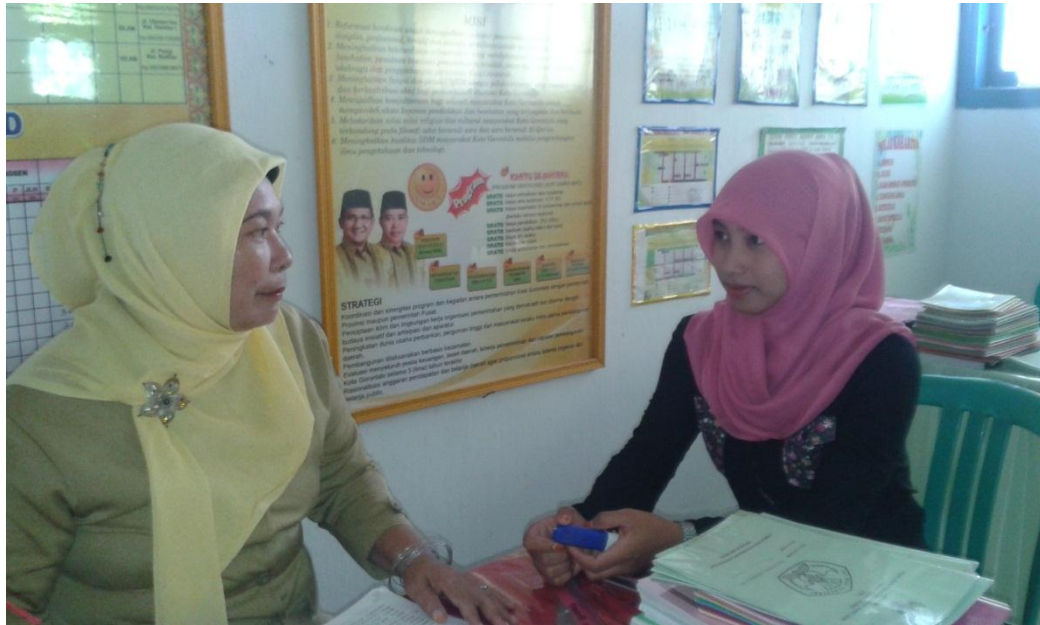
Gambar 1 : Peneliti sedang melakukan wawancara dengan Kepala Sekolah