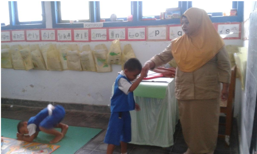
Gambar 8 : Anak yang mau bersalaman dengan guru