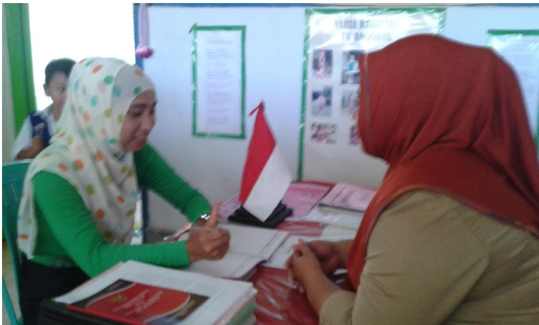
Gambar 2 : Peneliti sedang melakukan wawancara dengan guru TK Angrek