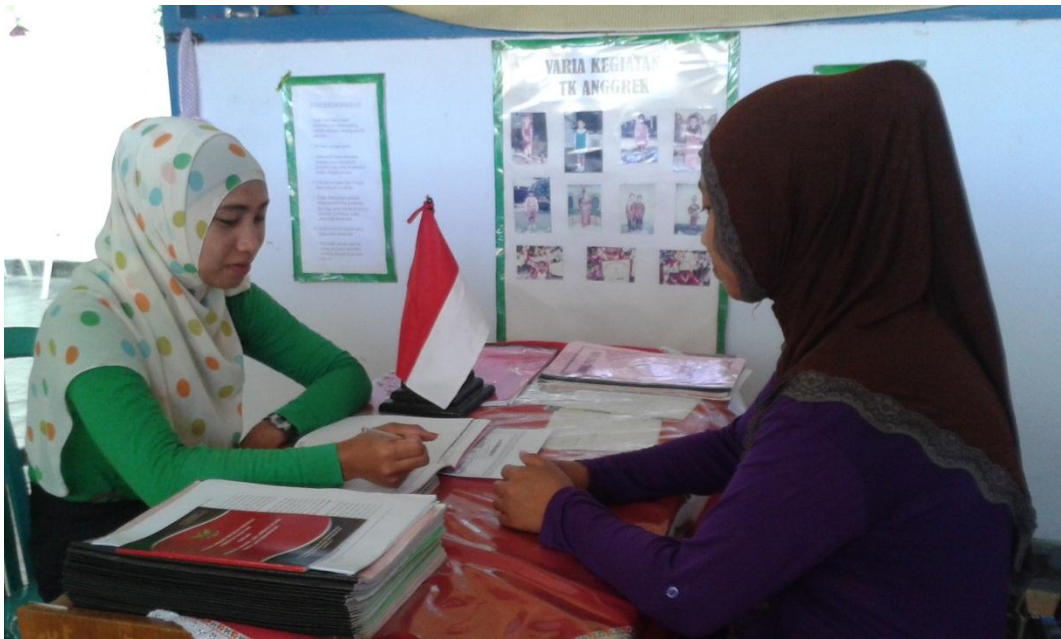
Gambar 4 : Peneliti sedang melakukan wawancara dengan salah satu Orang tua