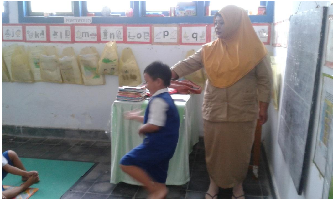
Gambar 5 : Anak yang berani tampil didepan kelas