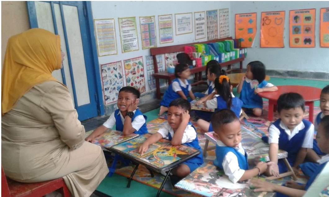
Gambar 6 : Anak yang berani menyatakan pendapatnya