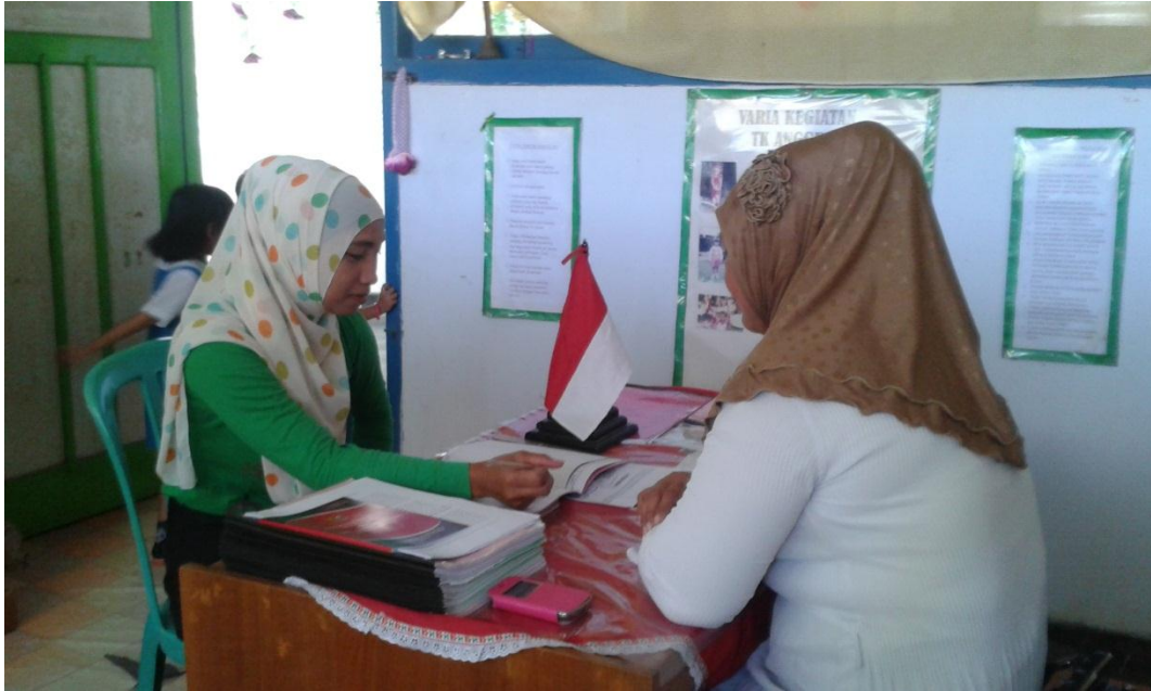
Gambar 3 : Peneliti sedang melakukan wawancara dengan guru TK Anggrek