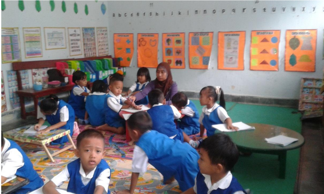
Gambar 7 : Anak yang masih memerlukan bantuan orang tua