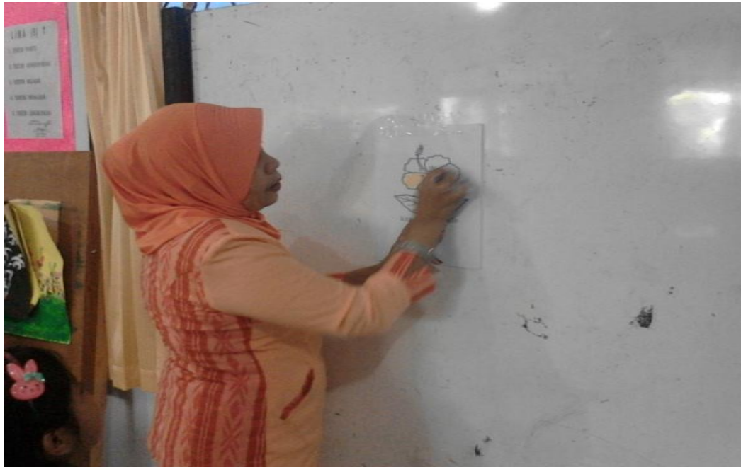
Gambar 5. Guru memberikan contoh cara menggunakan kelopak bunga untuk mewarnai