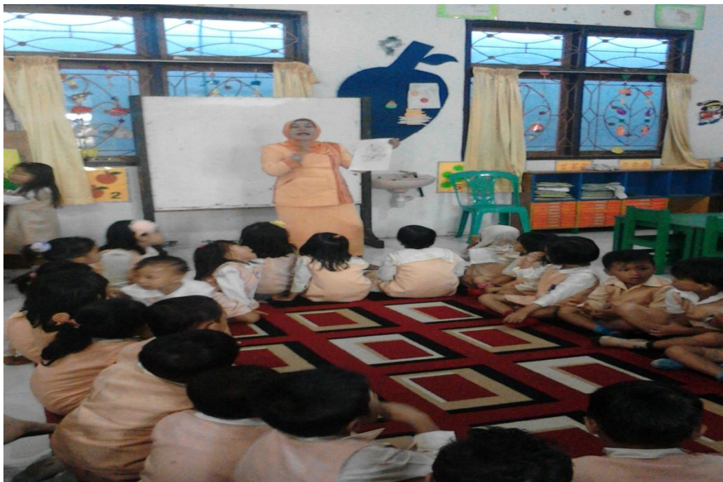
Gambar 4. Guru menjelaskan bagaimana cara memanfaatkan kelopak bunga untuk kegiatan mewarnai