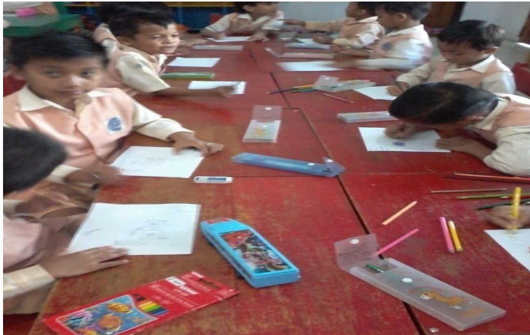
Gambar 9. Kegiatan anak dalam menggambar lingkungan sekolah dengan imajinasi