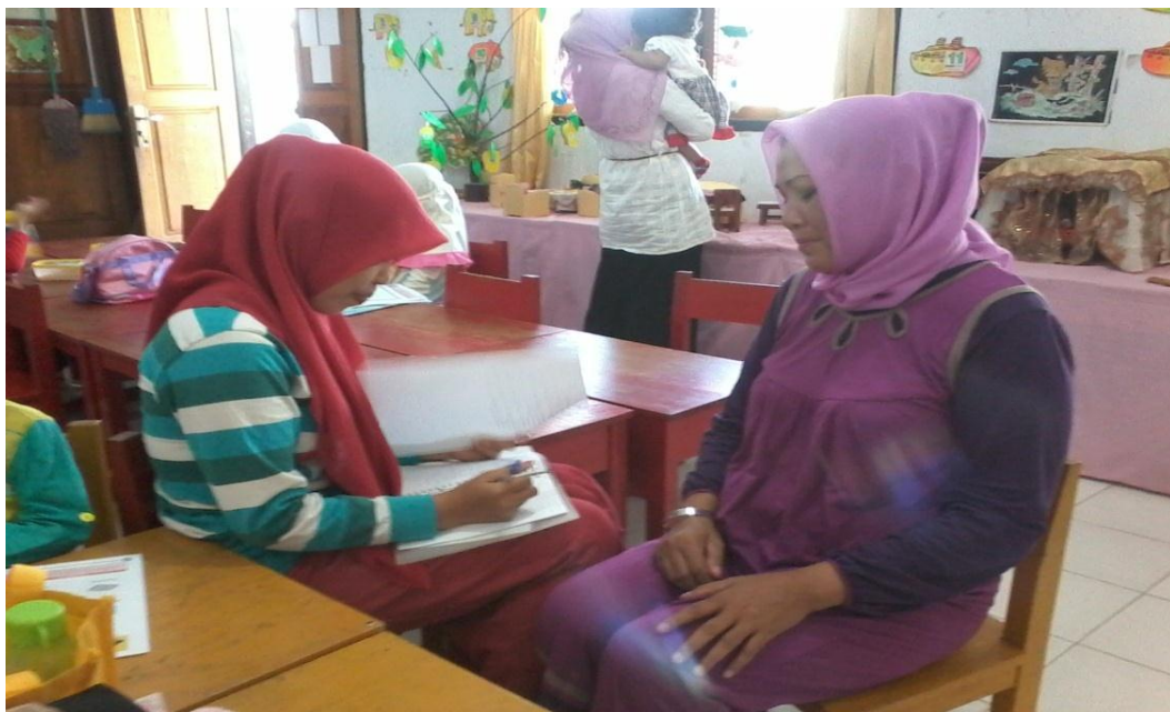
Gambar 14. Wawancara dengan orang tua murid