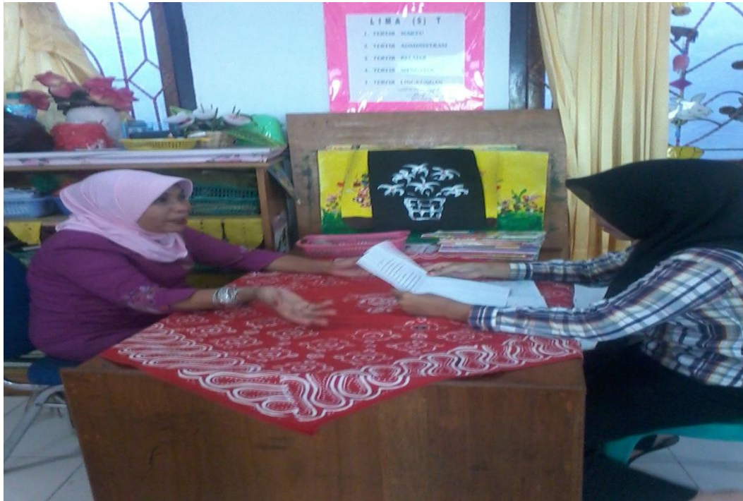
Gambar 13. Wawancara dengan guru kelompok B1