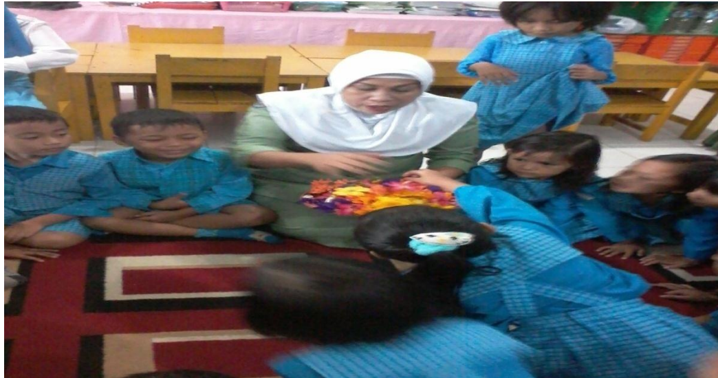
Gambar 1. Guru menjelaskan bagaimana cara mengidentifikasi jenis tanaman sesuai warna