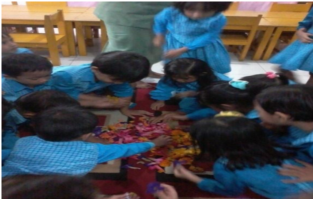
Gambar 2. Anak-anak mulai mencari jenis tanaman sesuai warna