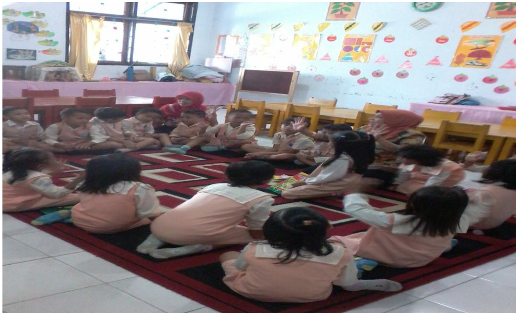
Gambar 8. Guru menjelaskan bagaimana cara menggambar lingkungan sekolah menggunakan imajinasi