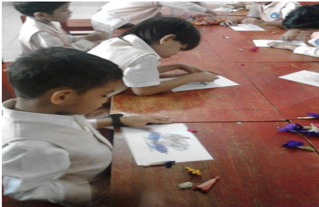
Gambar 6. Anak menyelesaikan kegiatan mewarnai dengan menggunakan kelopak bunga