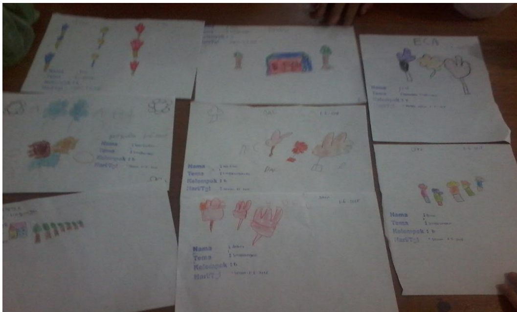
Gambar 10. Hasil karya anak menggambar lingkungan sekolah menggunakan imajinasi