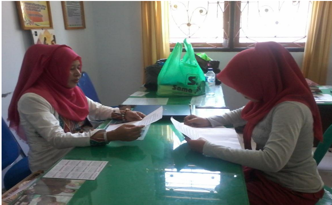
Gambar 11. Wawancara dengan kepala sekolah