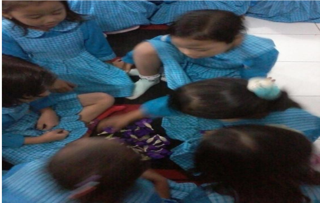
Gambar 3. Anak mengelompokkan tanaman sesuai warna