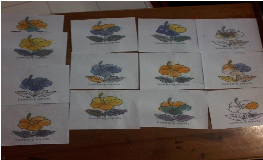
Gambar 7. Hasil karya anak dalam kegiatan mewarnai dengan menggunakan kelopak bunga