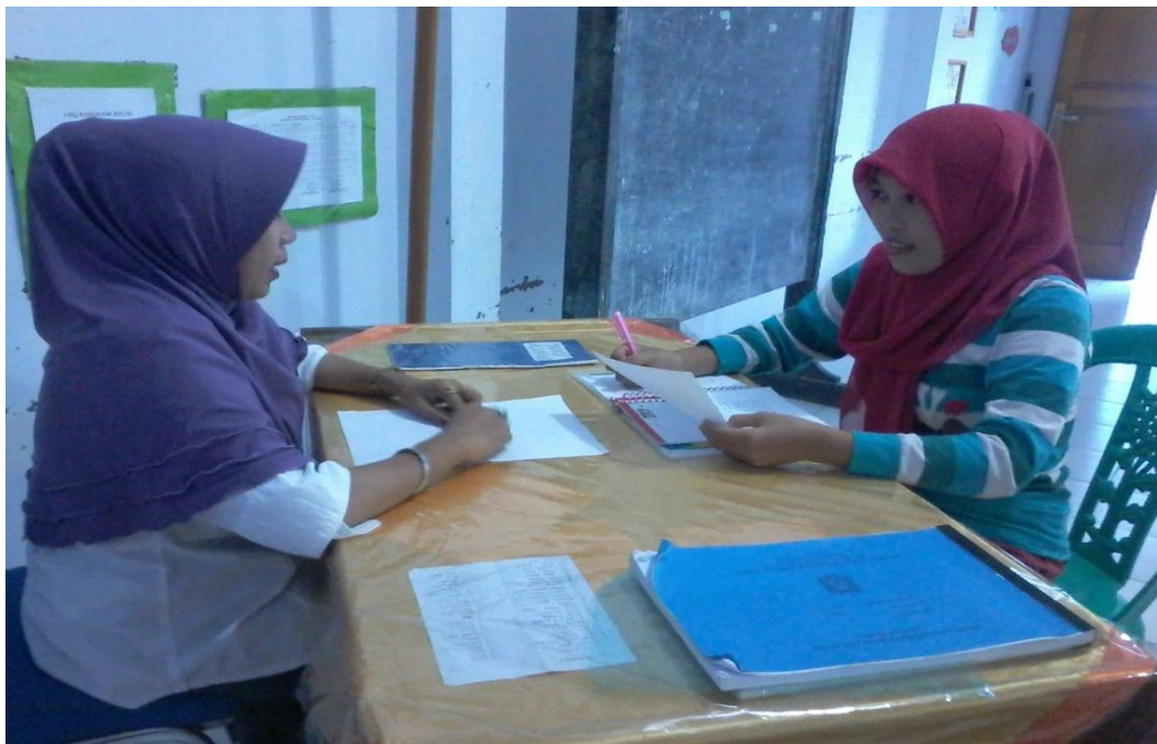
Gambar 12. Wawancara dengan guru kelompok B2