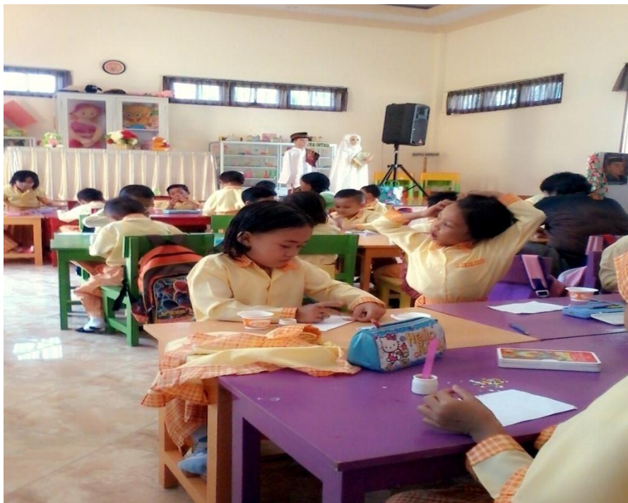
Gambar 15. Saat proses belajar mengajar