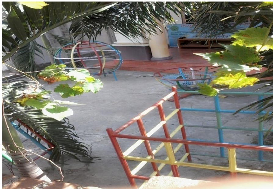
Gambar 2. Halaman depan dilihat dari atas