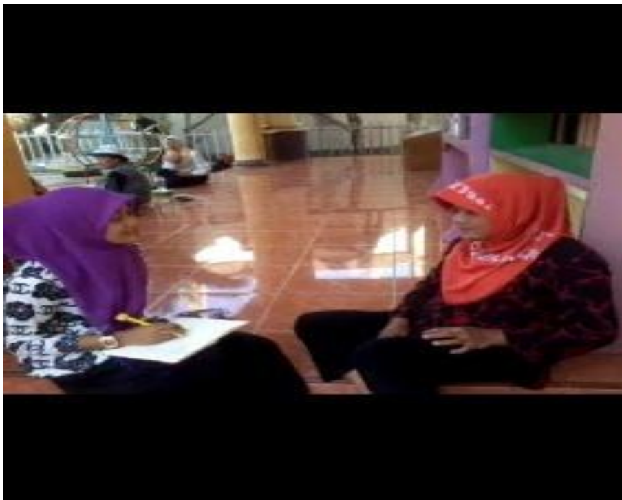
Gambar 11. Wawancara dengan Orang tua (3)