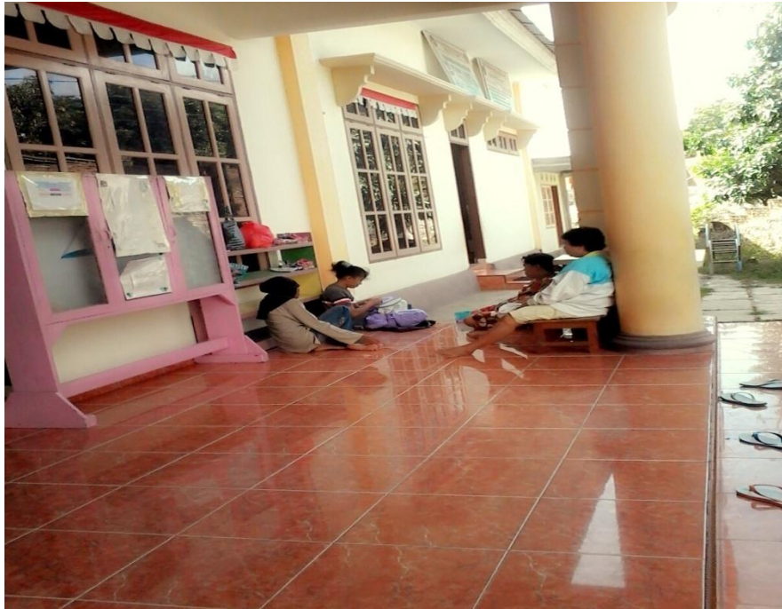
Gambar 14. Orang tua menunggu di luar