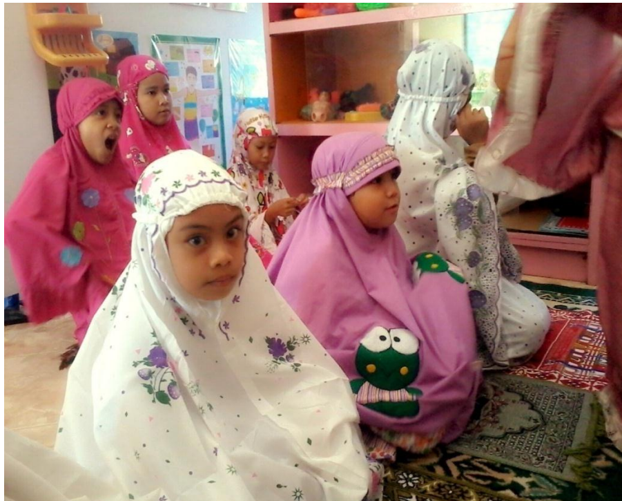
Gambar 16. Anak-anak sholat bersama