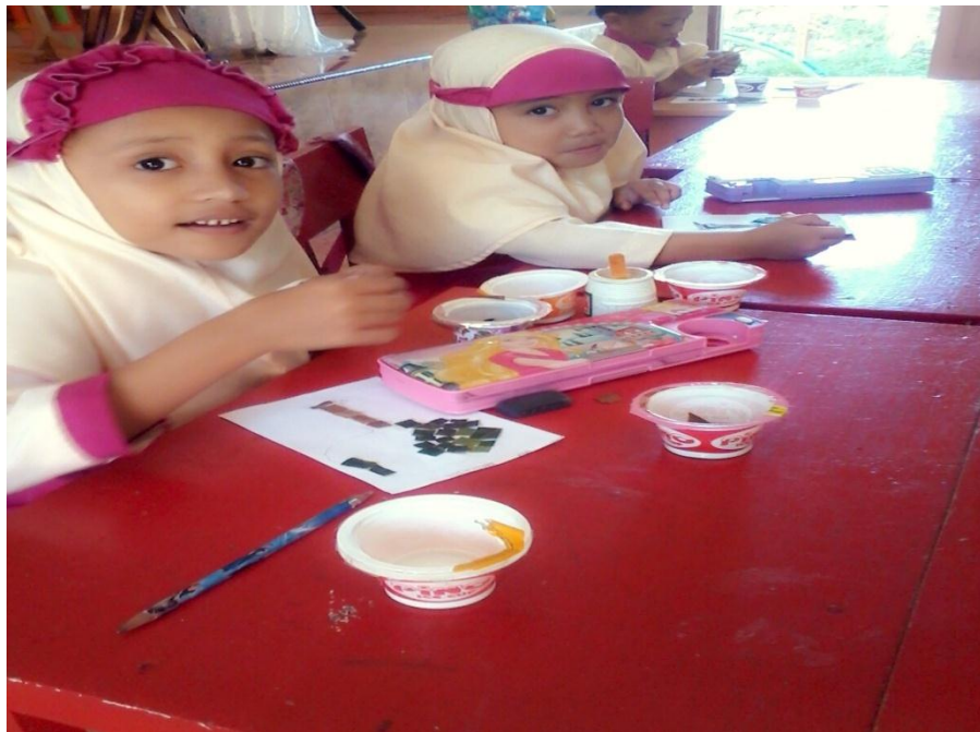
Gambar 5. Anak-anak melakukan kegiatan mengisi pola