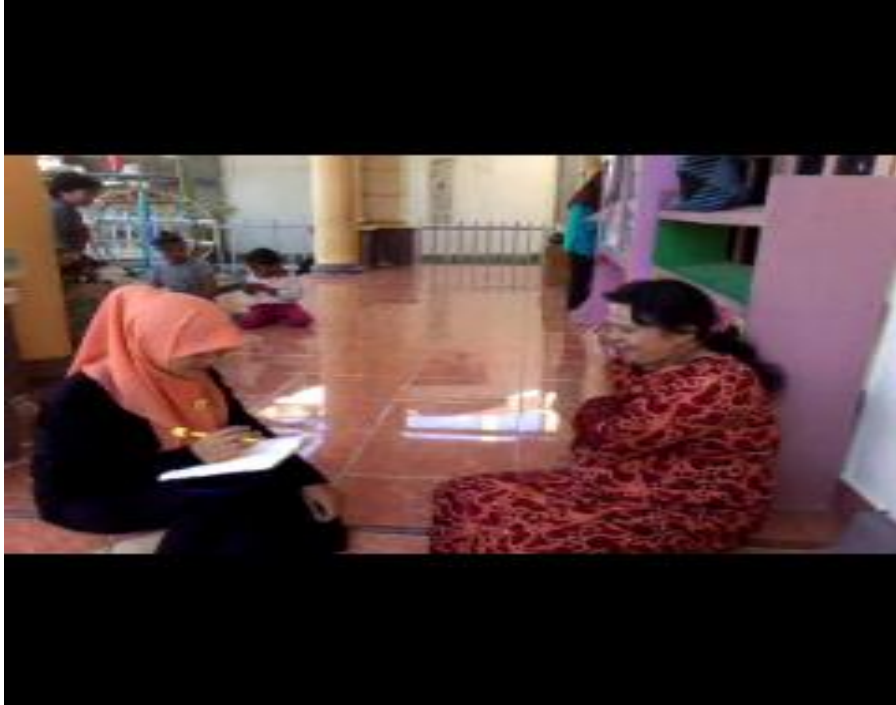
Gambar 9. Wawancara dengan Orang tua (YY)