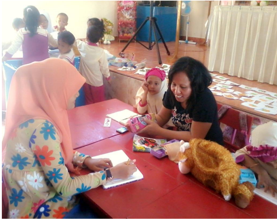
Gambar 12. Wawancara dengan Orang tua (4)