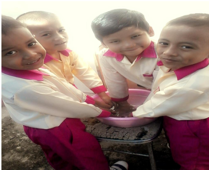
Gambar 13. Anak-anak mencuci tangan sendiri