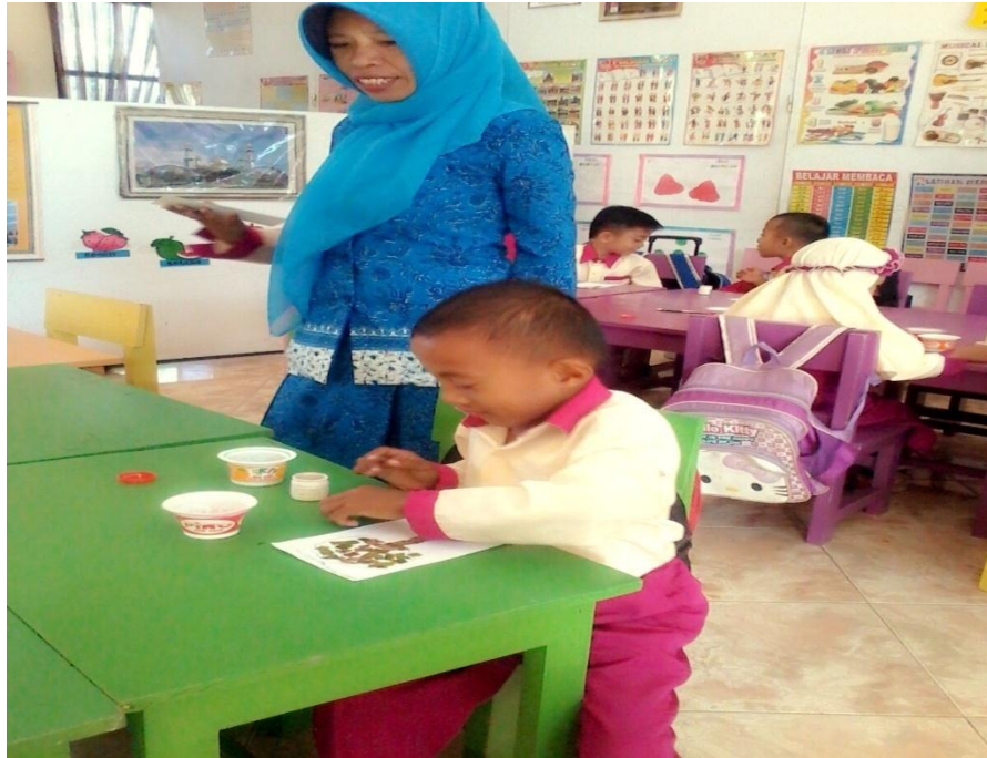
Gambar 3. Guru mengajarkan kepada anak mengisi pola