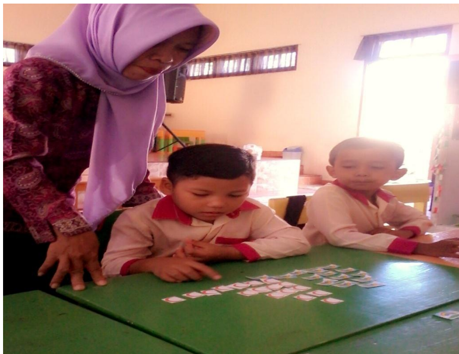
Gambar 4. Guru mengajar menyusun gambar angka terkecil-terbesar