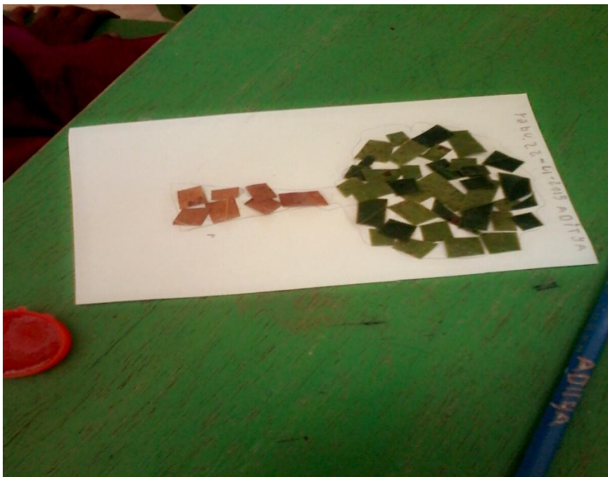
Gambar 7. Hasil karya Anak mengisi pola