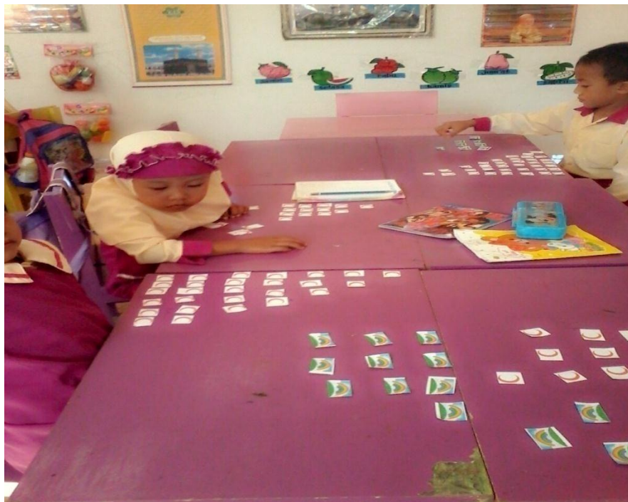
Gambar 6. Anak-anak menyusun gambar dari angka kecil-besar