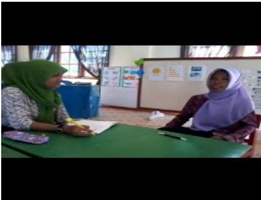
Gambar 8. Wawancara dengan Kepala Sekolah/Guru Kelompok B