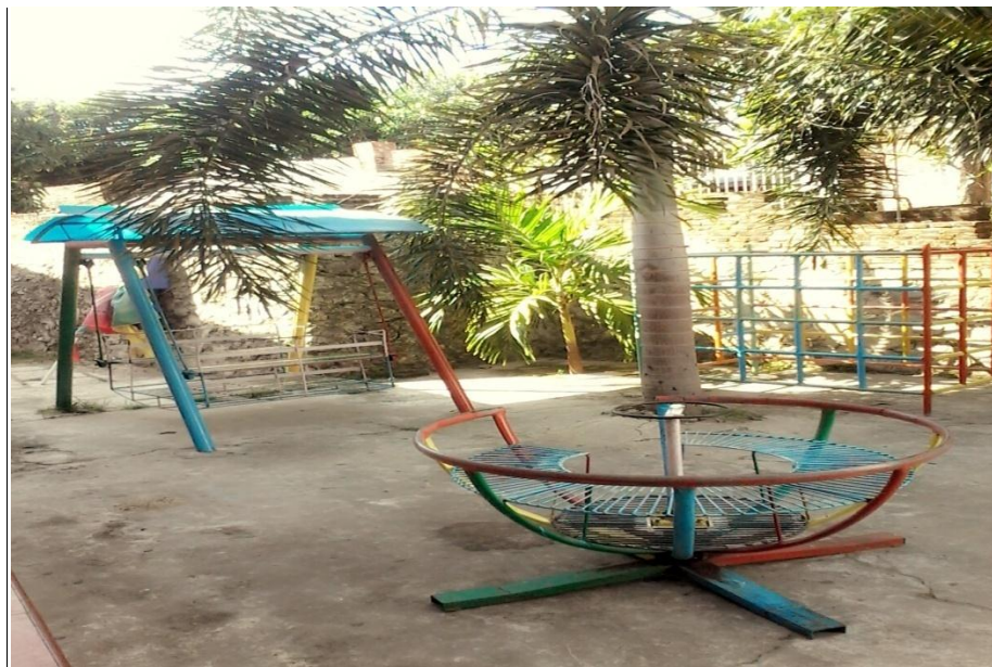
Gambar 1. Halaman depan sekolah