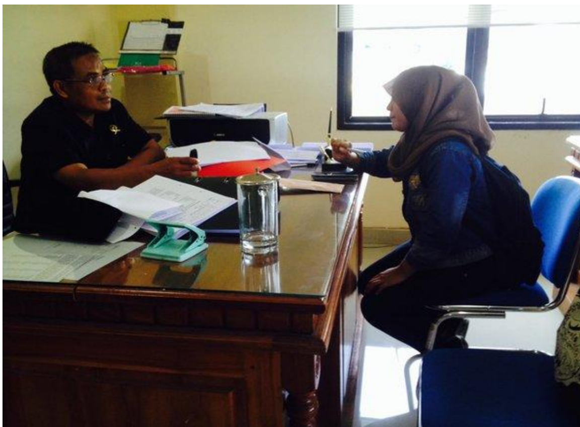
Wawancara dengan Bapak