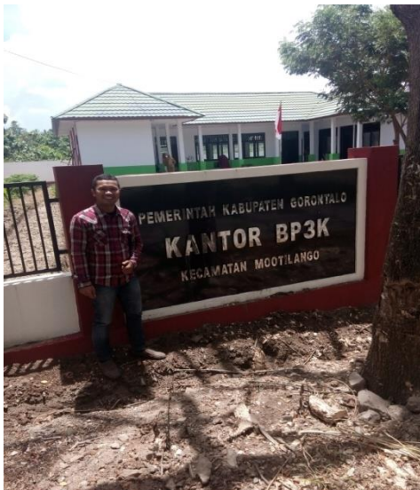
Kantor BP3K Kecamatan Mootilango