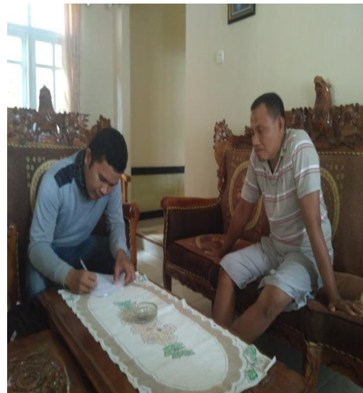
Wawancara dengan responden