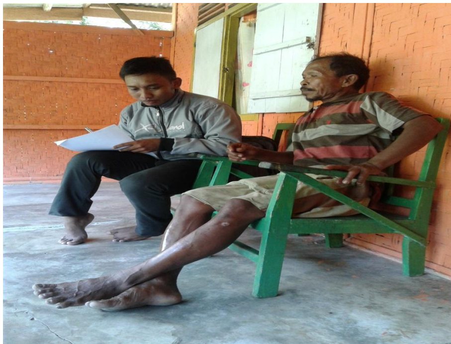
Wawancara Bersama Petani Kacang Tanah di Desa Huidu Utara