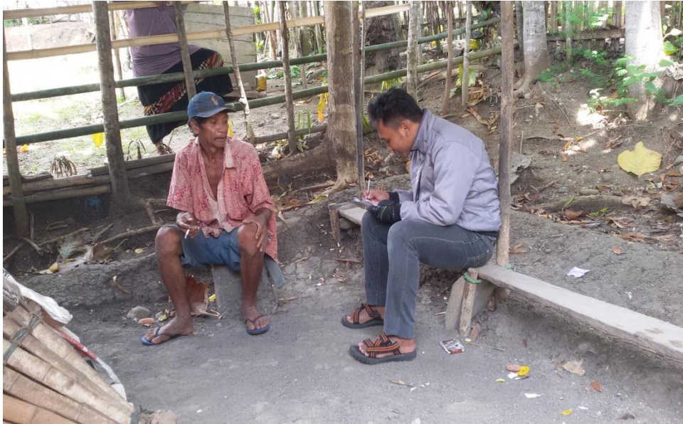
Wawancara Bersama Petani Kacang Tanah di Desa Huidu Utara