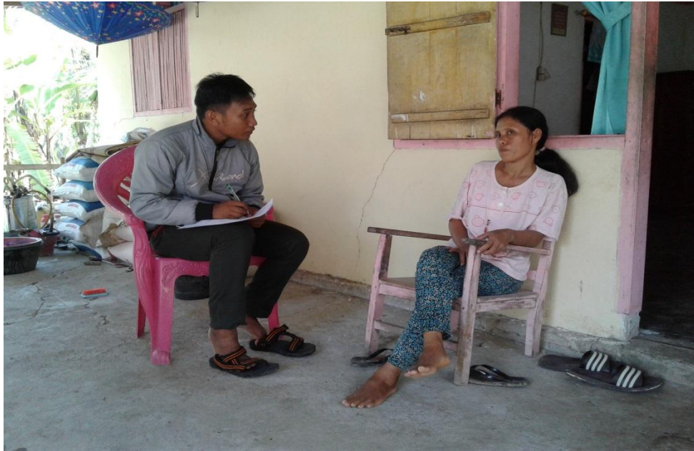
Wawancara Bersama Petani Kacang Tanah di Desa Huidu Utara