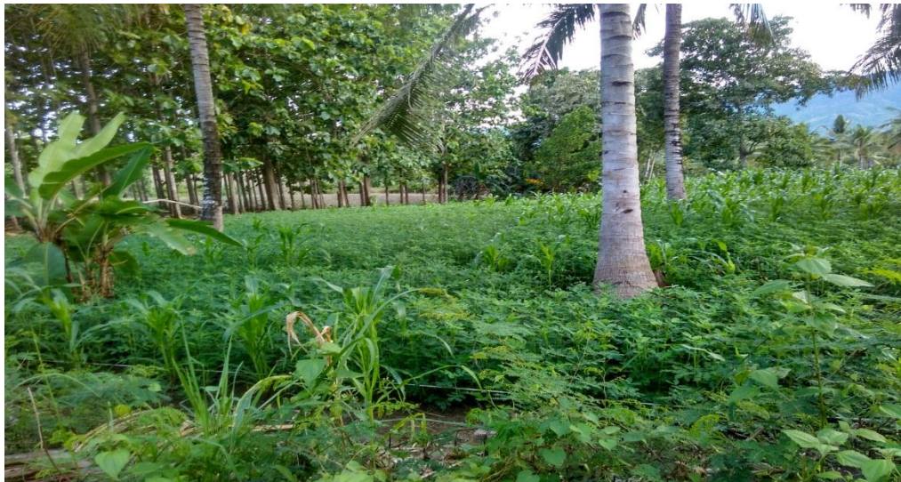
Gambar Lokasi Penelitian Kacang Tanah