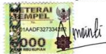
Nur Oktaviány Mointi