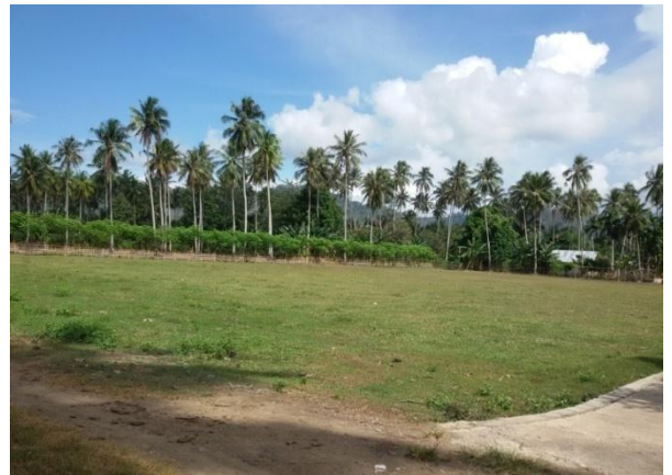
Lapangan Sepak Bola