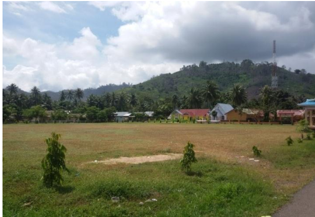
Lapangan Sepak Bola