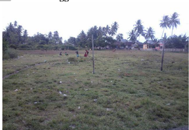
Lapangan Sepak Bola