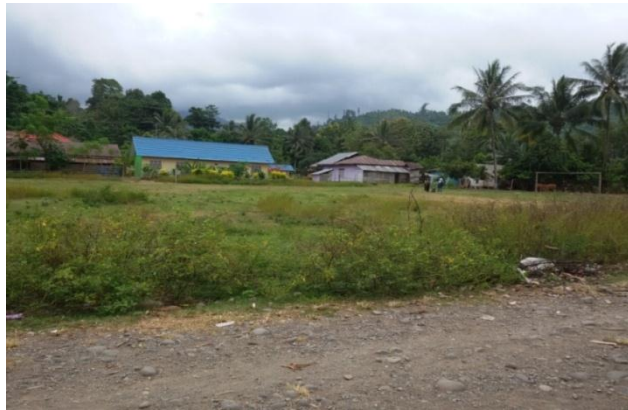
Lapangan sepak bola