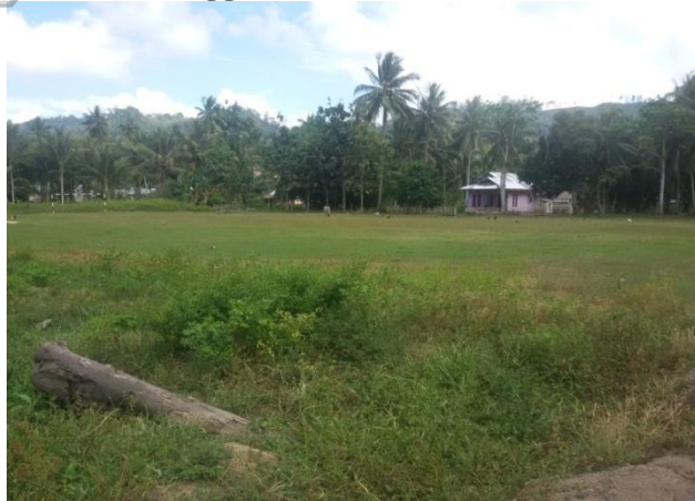
Lapangan Sepak Bola