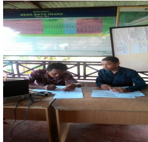
Sekdes Tunas Jaya