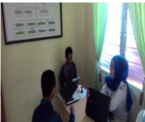
Ketua Karang Taruna Desa Uabanga