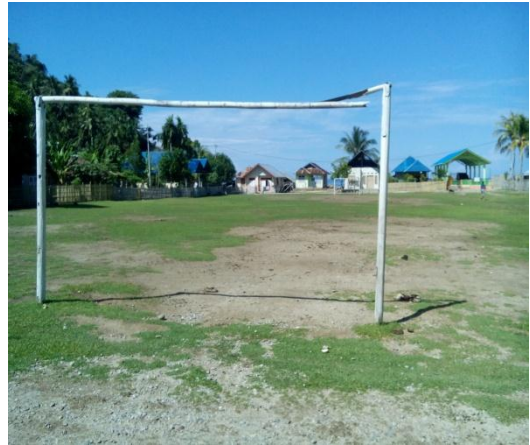
Lapangan sepak takraw