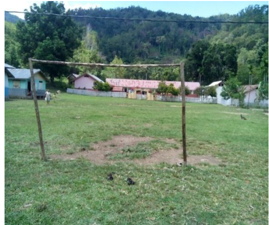
Lapangan sepak takraw