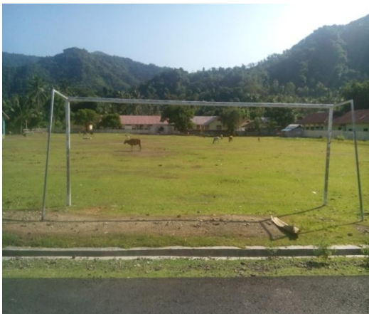
Desa Bilungala Utara