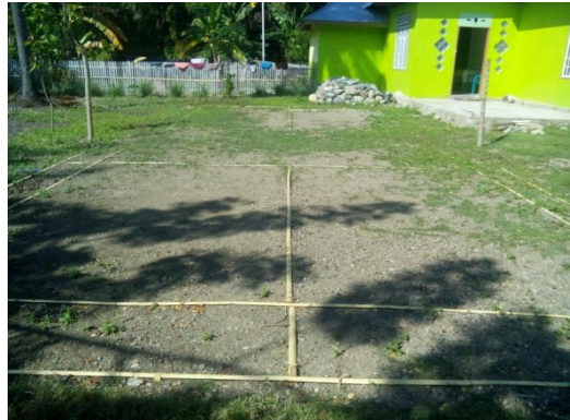
Lapangan bulu tangkis