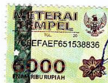
(MONA YULITA TAHIR)