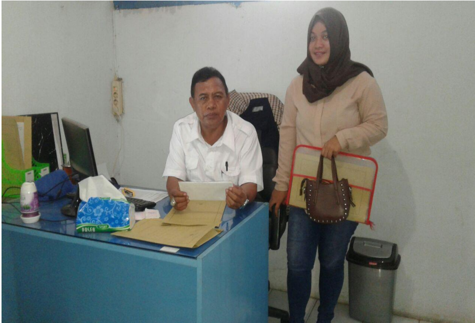
Wawancara dengan Sekretaris TKBM