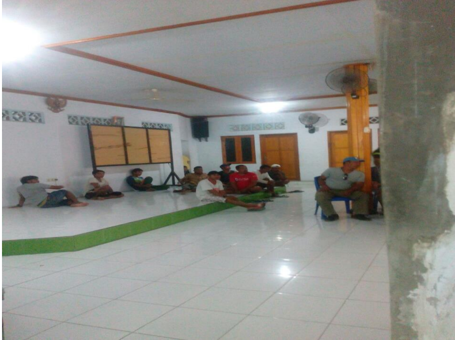
Para Kerja TKBM