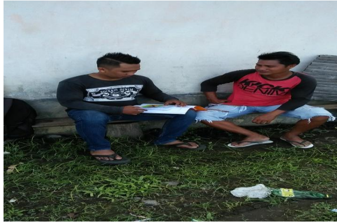
Gambar 1.3 Suasana wawancara dengan masyarakat tombulilato