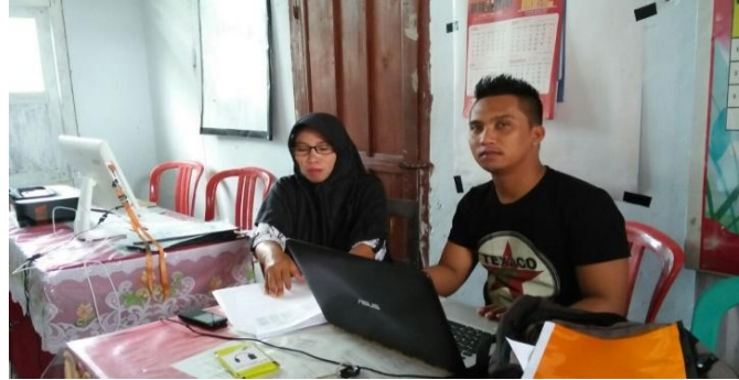
Gambar 1.1 Suasana Wawancara dengan Sekretaris Desa Tombulilato