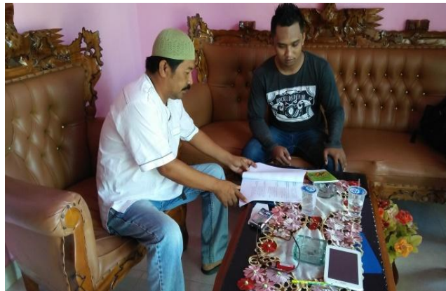
Gambar 1.3 Suasana wawancara dengan salah satu tokoh masyarakat