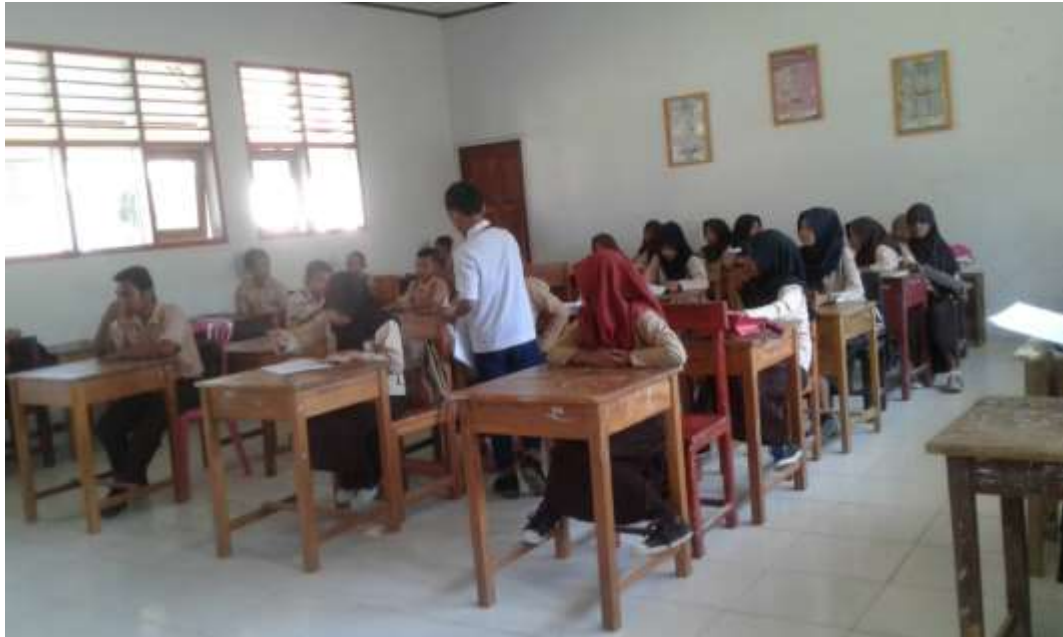
Foto salah seorang siswa sedang membagikan anget ke siswa lainnya