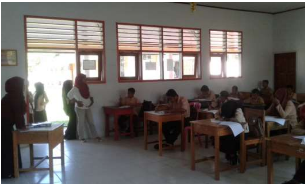
Foto peneliti sedang menjelaskan cara pengisian angket