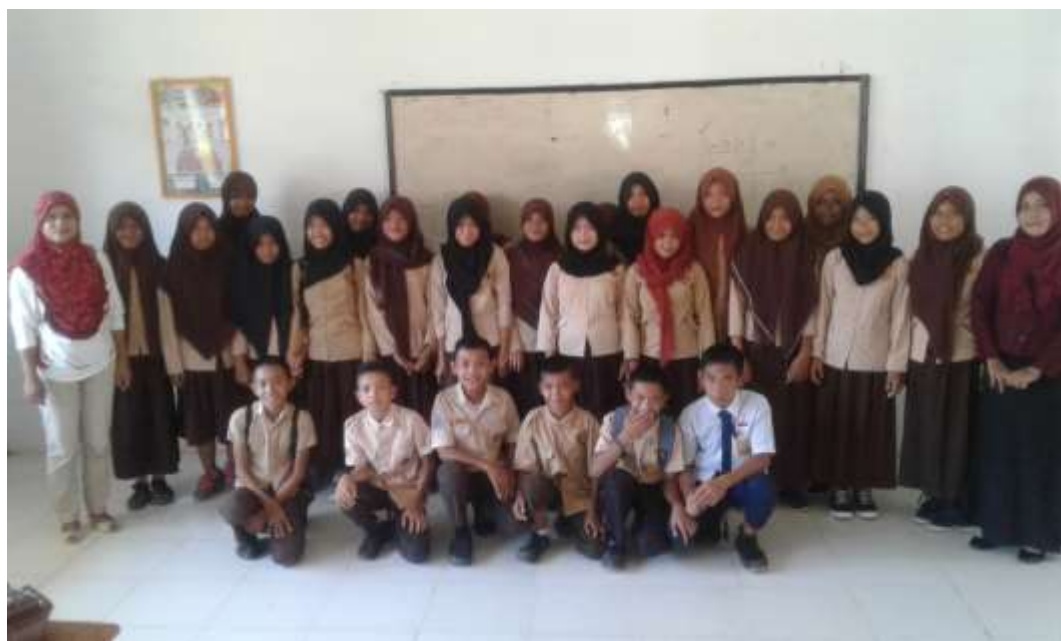
Foto bersama siswa kelas VIII, peneliti dan guru Penjasorkes