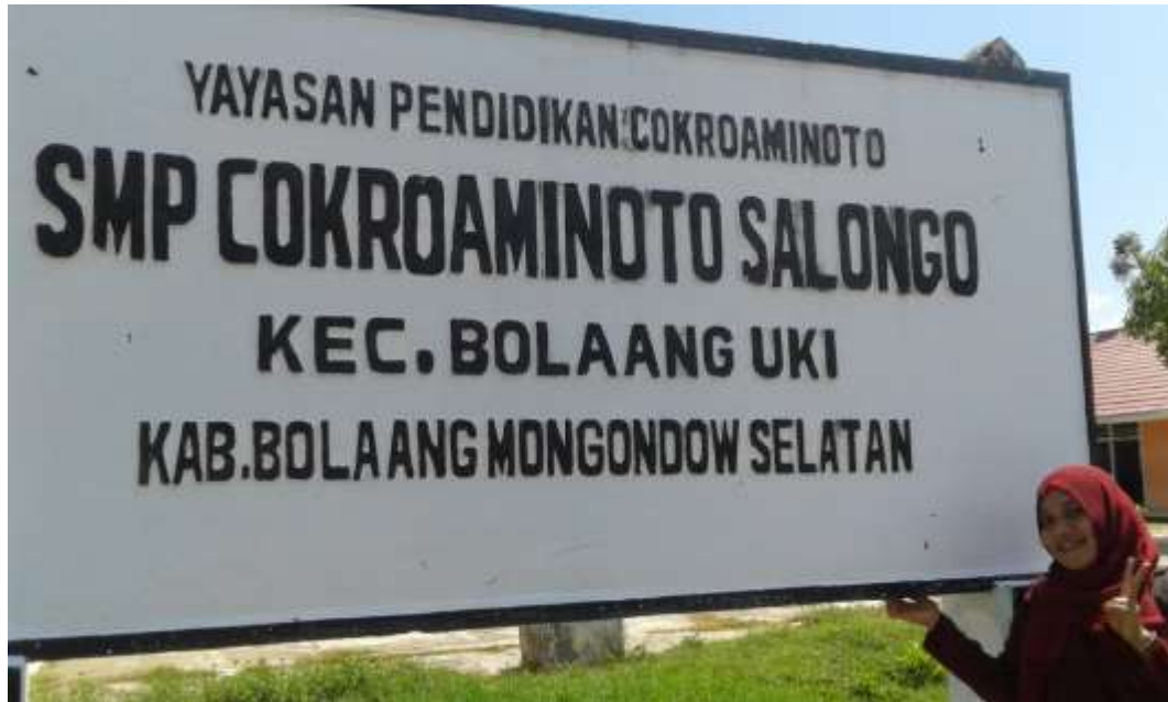
Foto papan sekolah