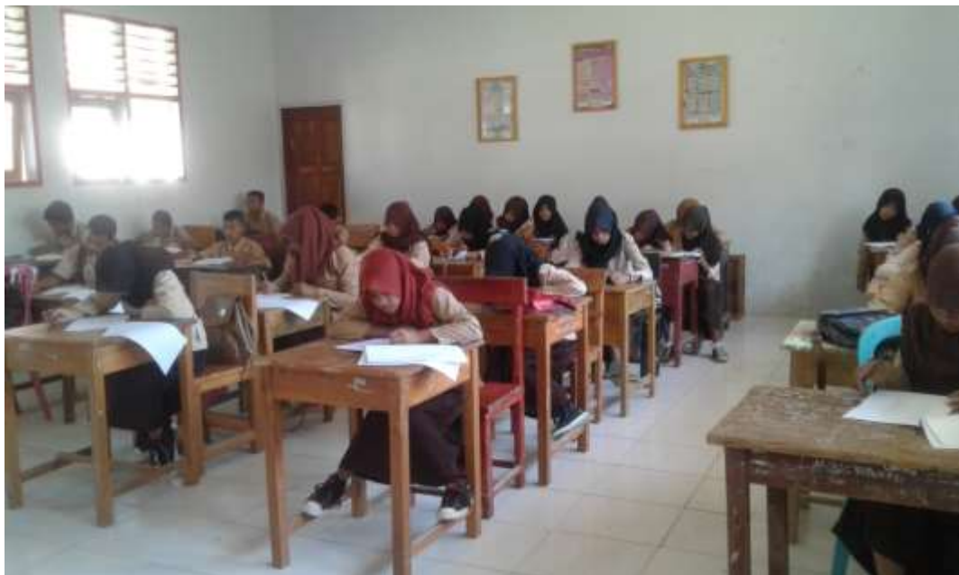
Foto siswa sedang mengisi anget