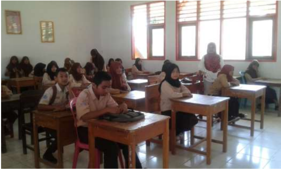
Foto persiapan pelaksanaan pengisian angket