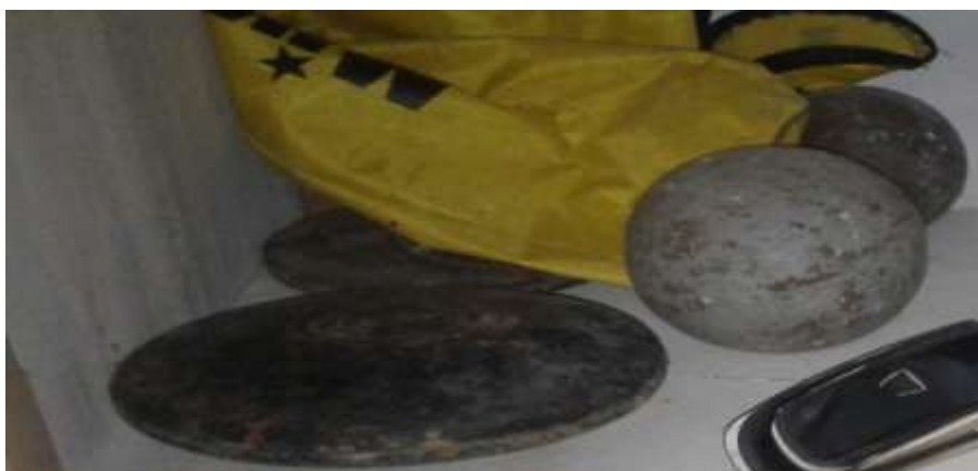
Cakram dan Peluru