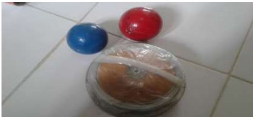
Peluru Dan Cakram