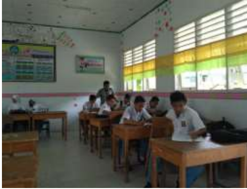
KELAS XI IPS 1