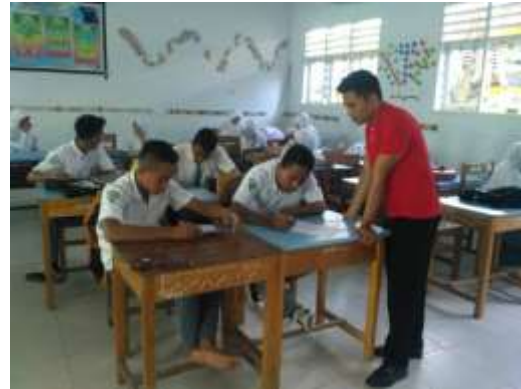
KELAS XI IPS 2