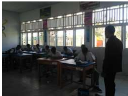
KELAS X IPS 3