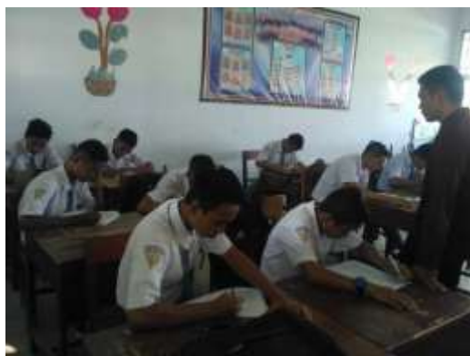
KELAS X IPS 4