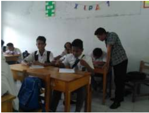
KELAS X IPA 1