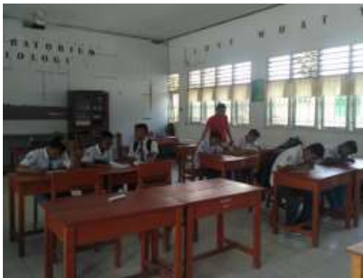
KELAS XI IPS 3