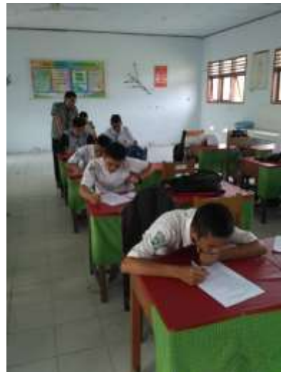
KELAS XI IPA 4