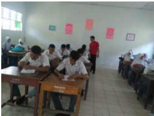
KELAS X IPA 3