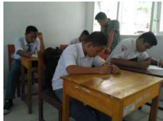
KELAS X IPA 2