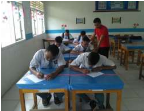
KELAS XI IPA 3