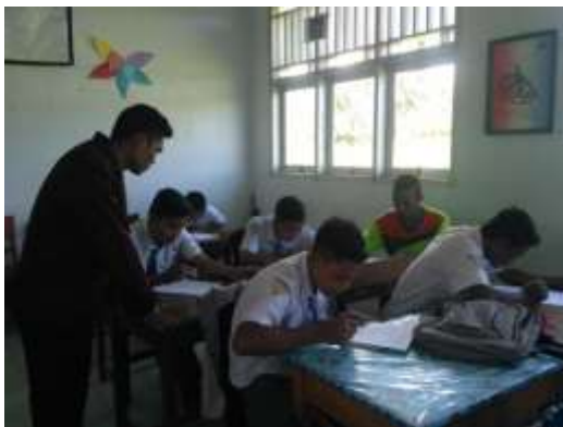
KELAS X IPS 2