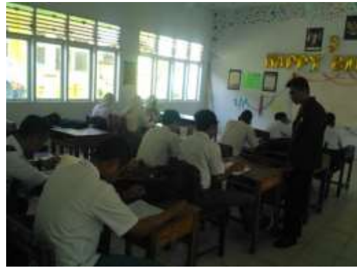
KELAS X IPA 4