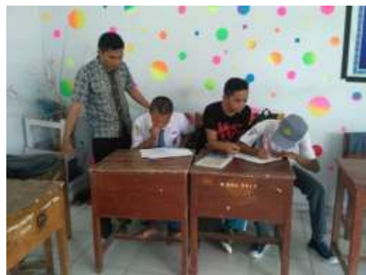
KELAS X IPS 1