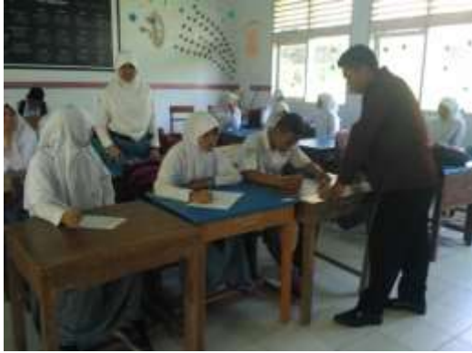
KELAS XI IPA 1