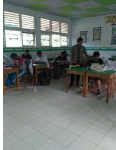
KELAS XI IPA 2