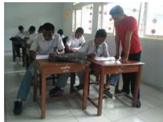
KELAS XI IPS 4