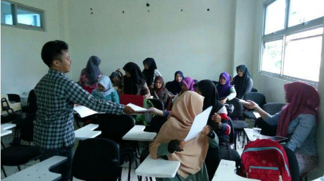
Dokumentasi Penyebaran Angket Kamis - Jumat 1 - 2 September 2016