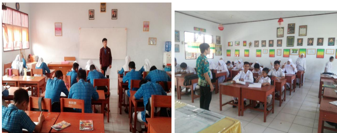
Pembagian Instrumen Angket