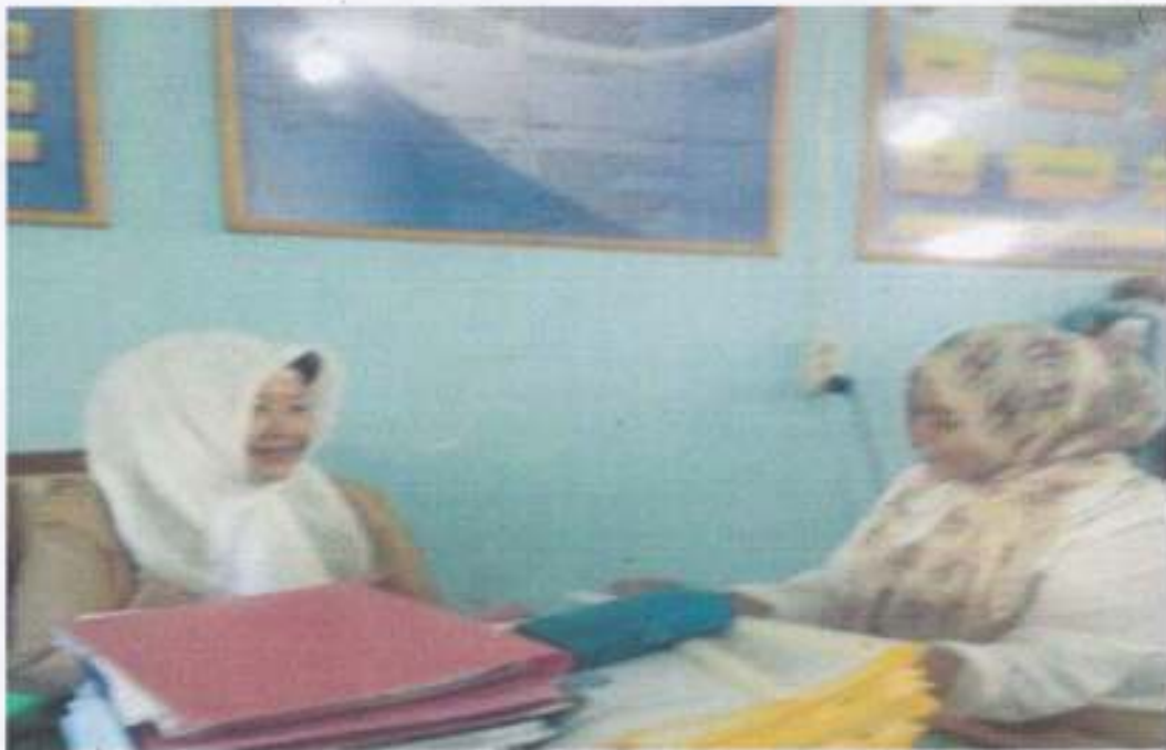
WAWANCARA DENGAN GURU KELAS