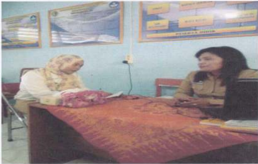
WAWANCARA DENGAN GURU BIMBINGAN KONSELING