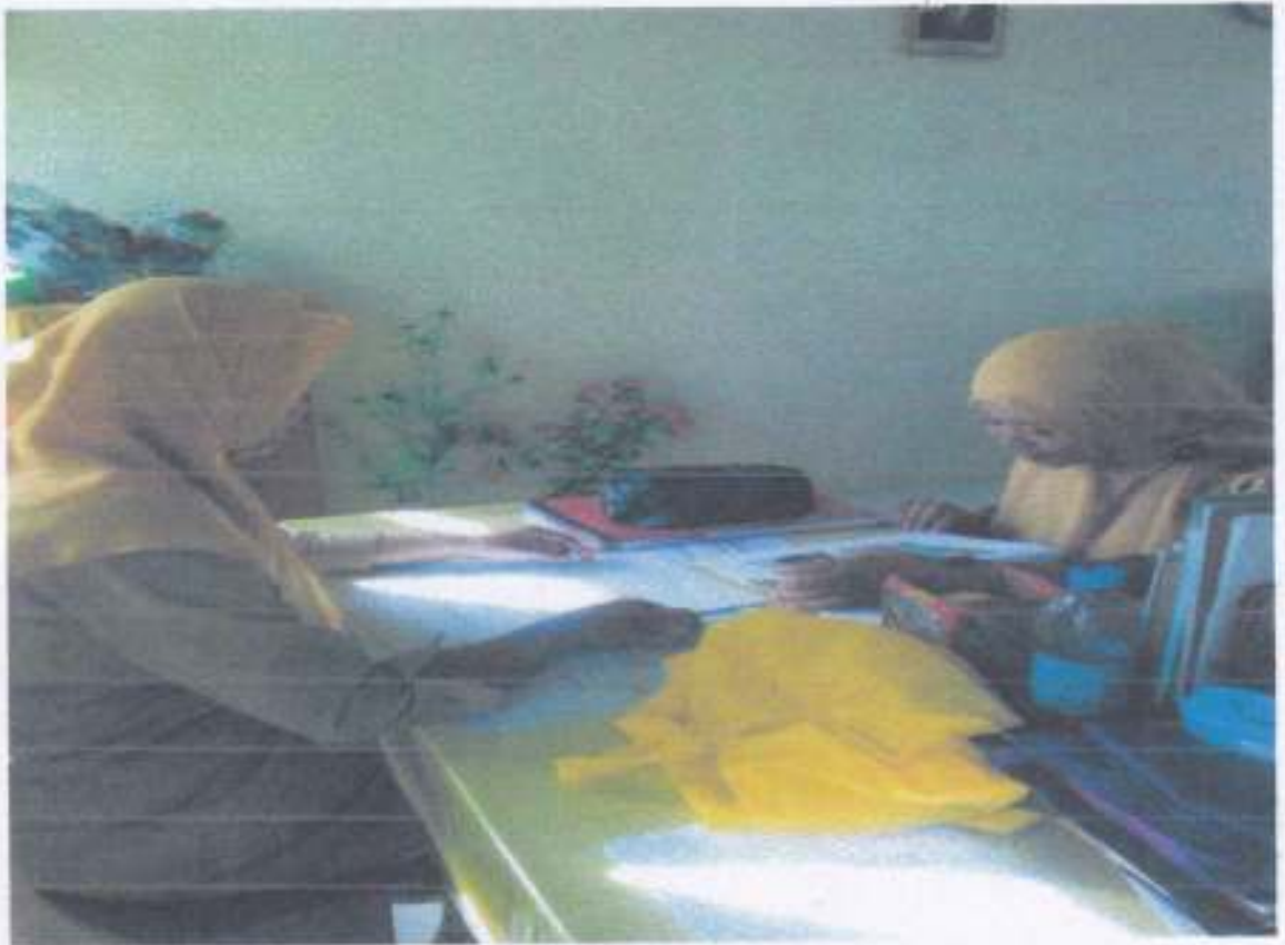
WAWANCARA DENGAN GURU KELAS