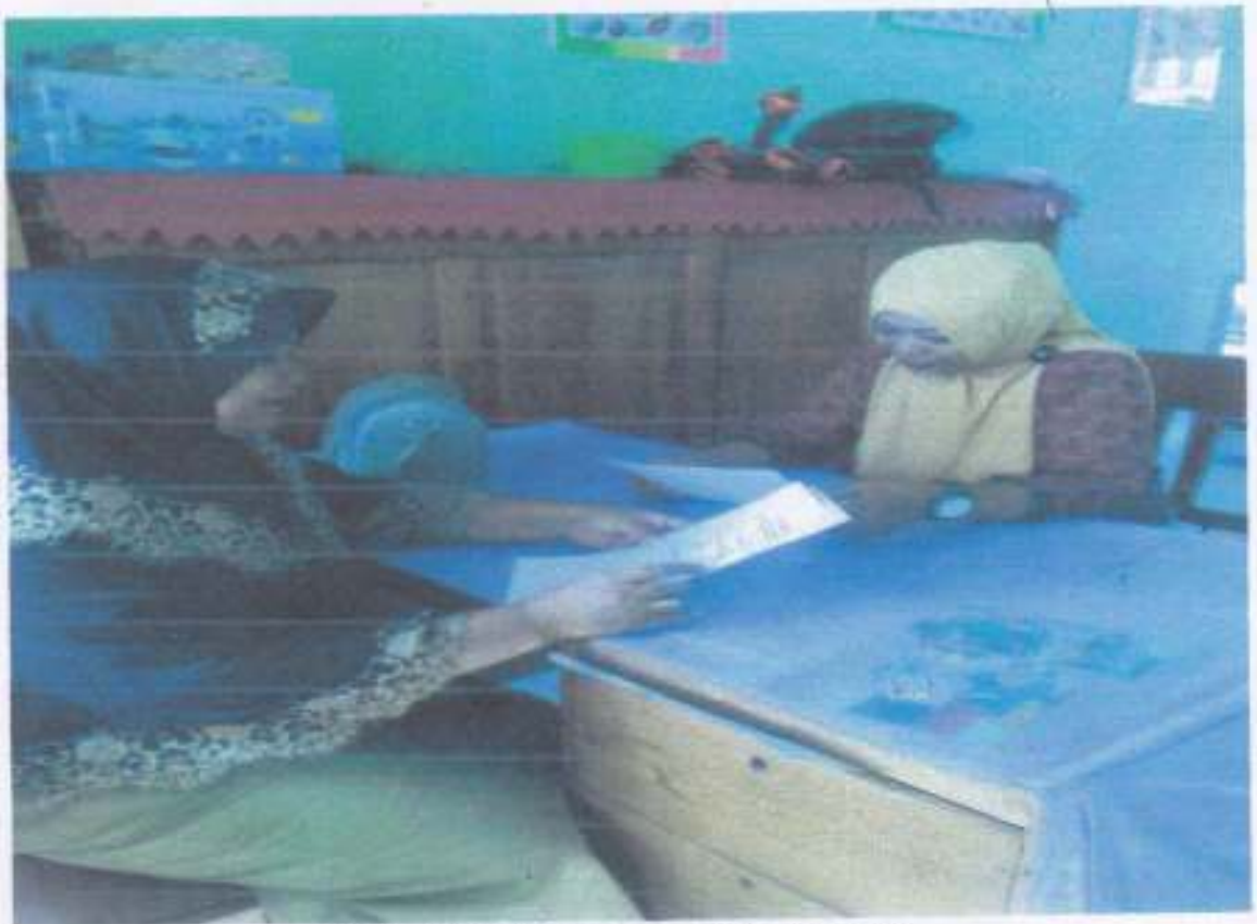
WAWANCARA DENGAN GURU KELAS