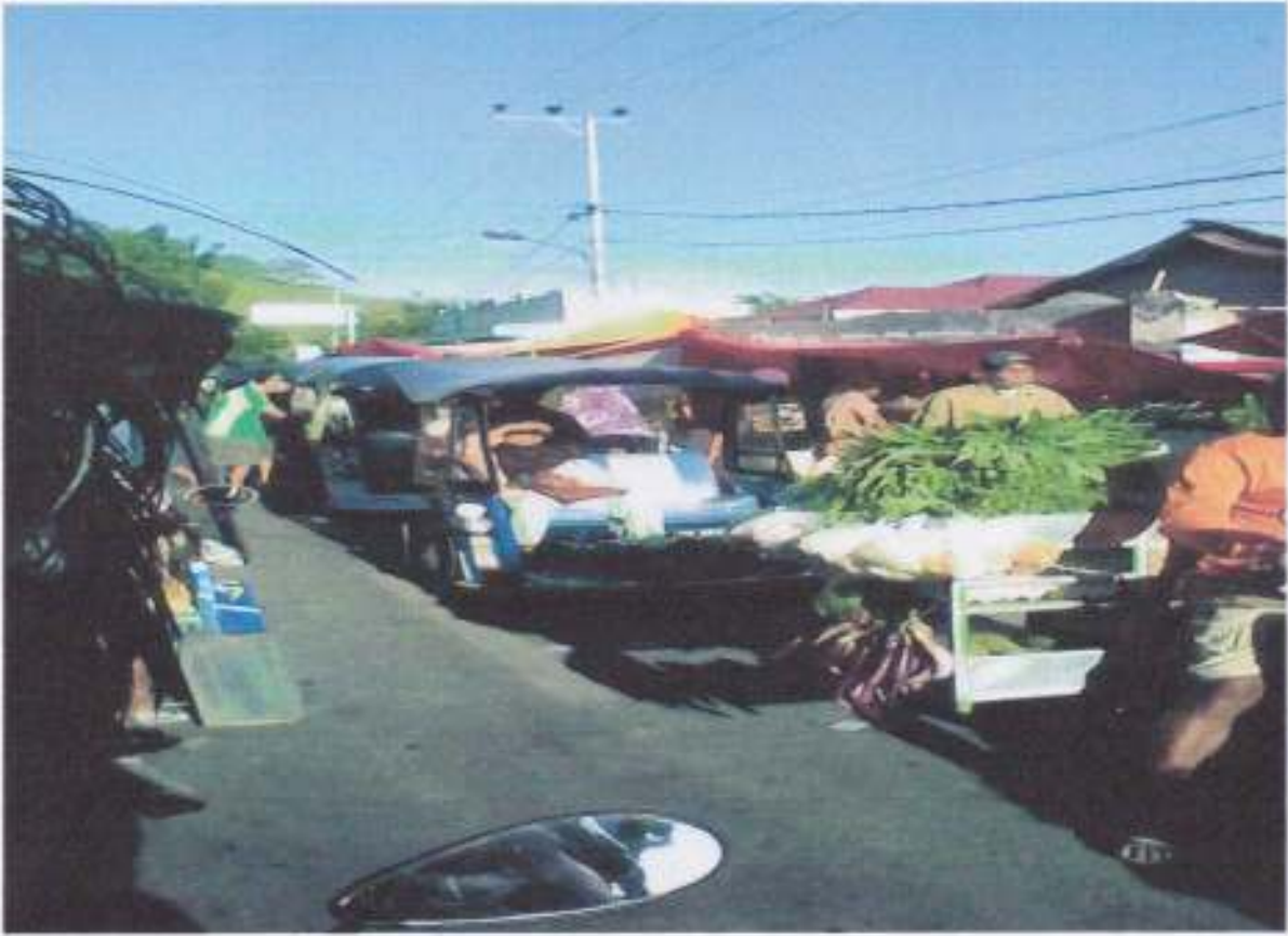
Akses menuju sekolah melalui pasar tradisional