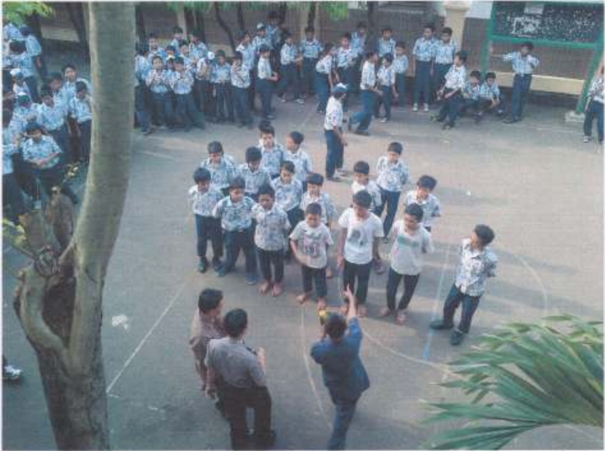
Saat terjadi konflik antar kelompok