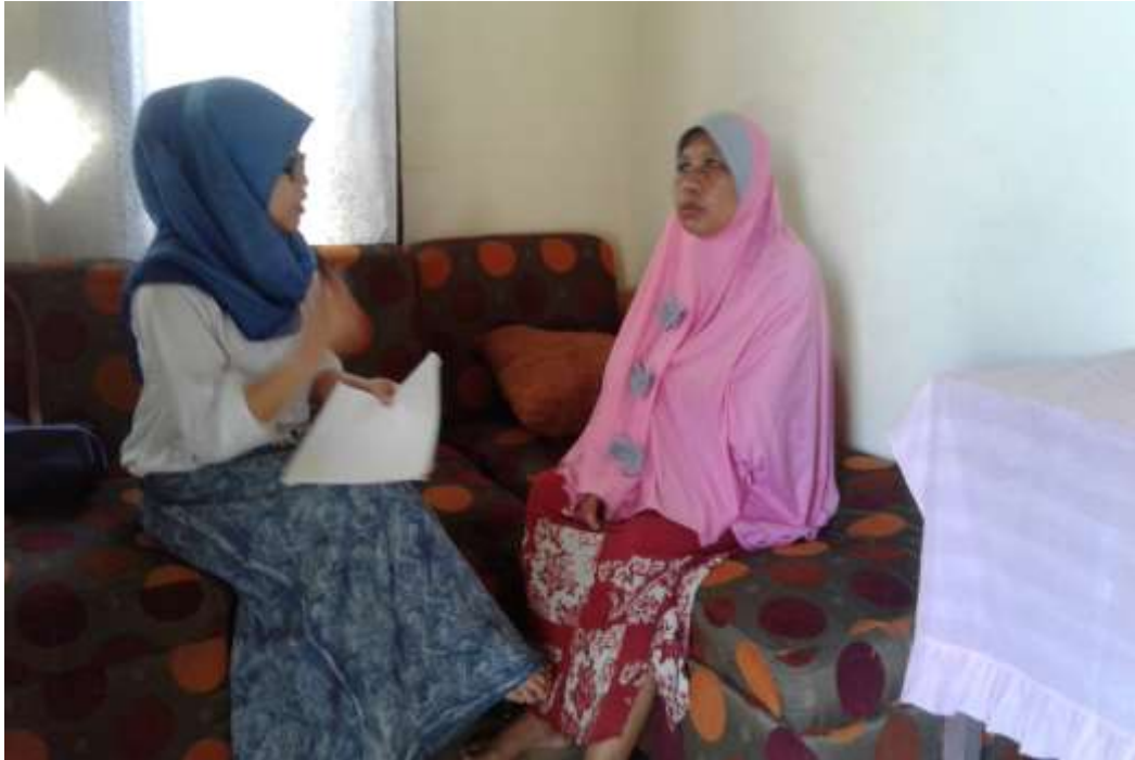
Gambar 6. Wawancara dengan Anggota Membuat Kue di KUD Indah Jaya