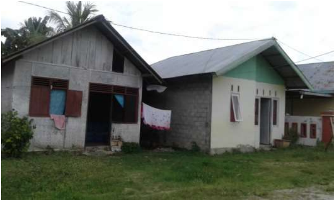
Gambar 24. Rumah Anggota yang belum mengalami peningkatan