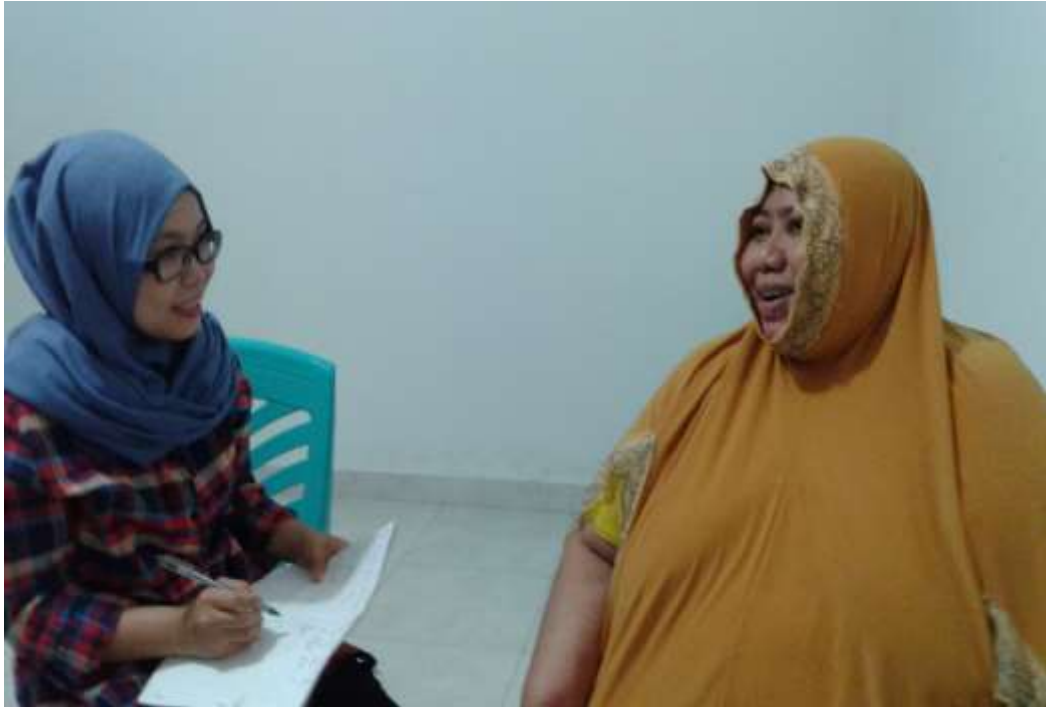
Gambar 8. Wawancara dengan Anggota Membuat Makanan di KUD Indah Jaya