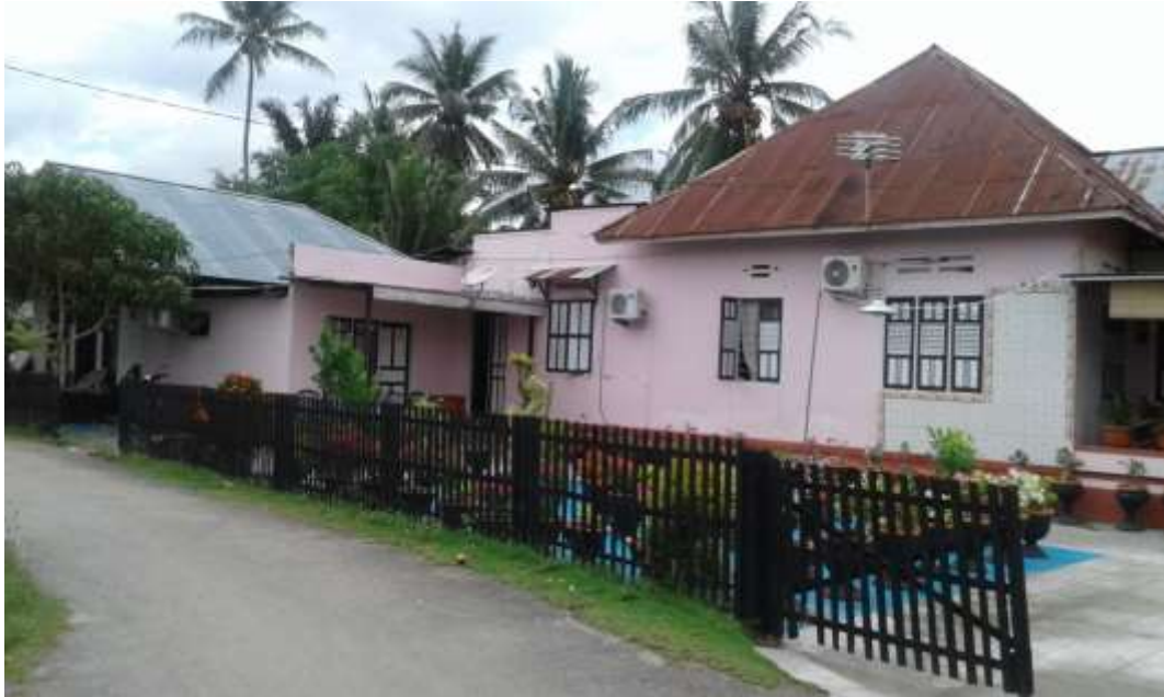
Gambar 22 Rumah Anggota yang mengalami sedikit peningkatan