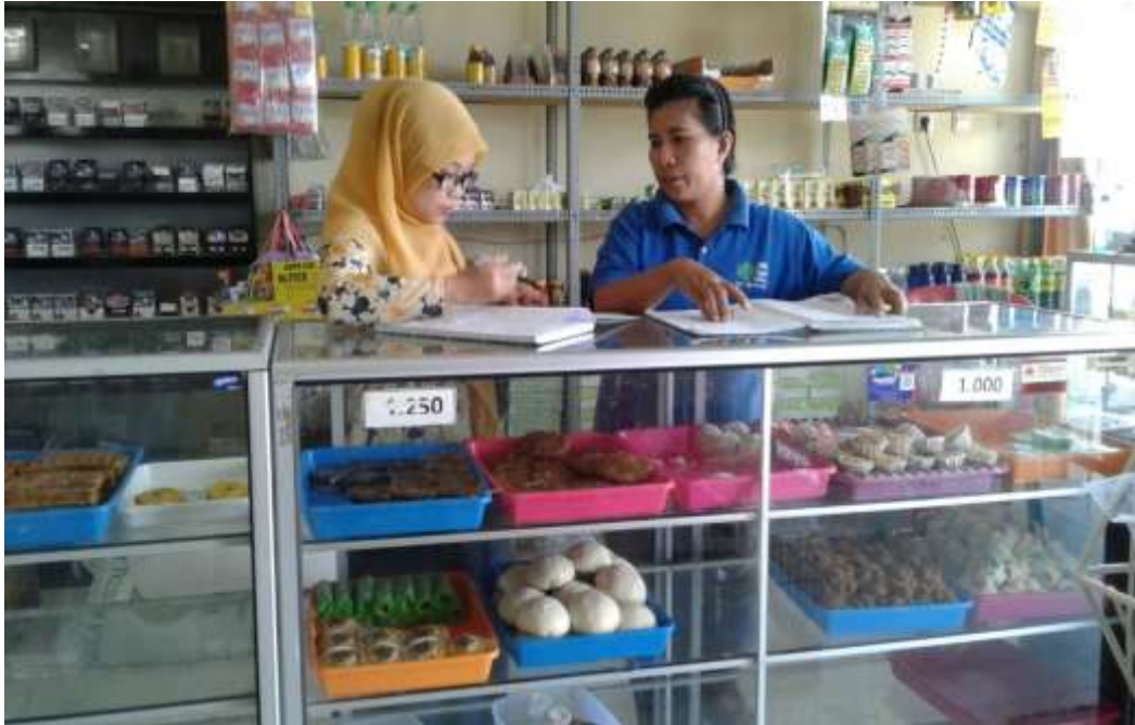
Gambar 4. Wawancara dengan Karyawan KUD Indah Jaya