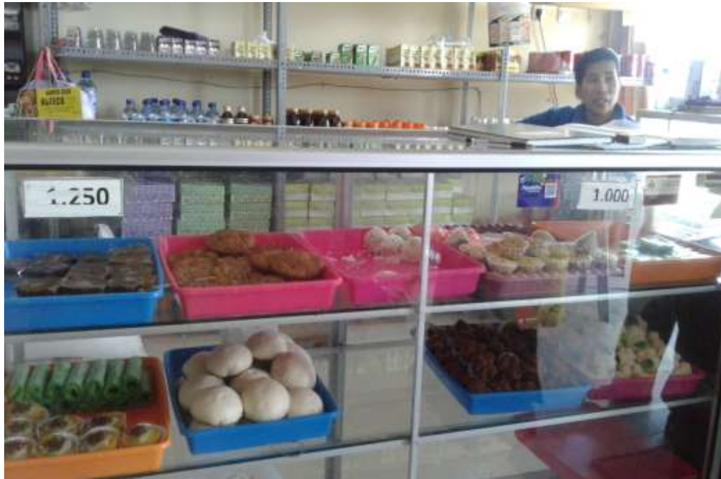
Gambar 12. Jenis-Jenis Kue yang di Pasarkan di KUD Indah Jaya