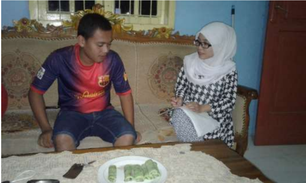
Gambar 10. Wawancara dengan Masyarakat