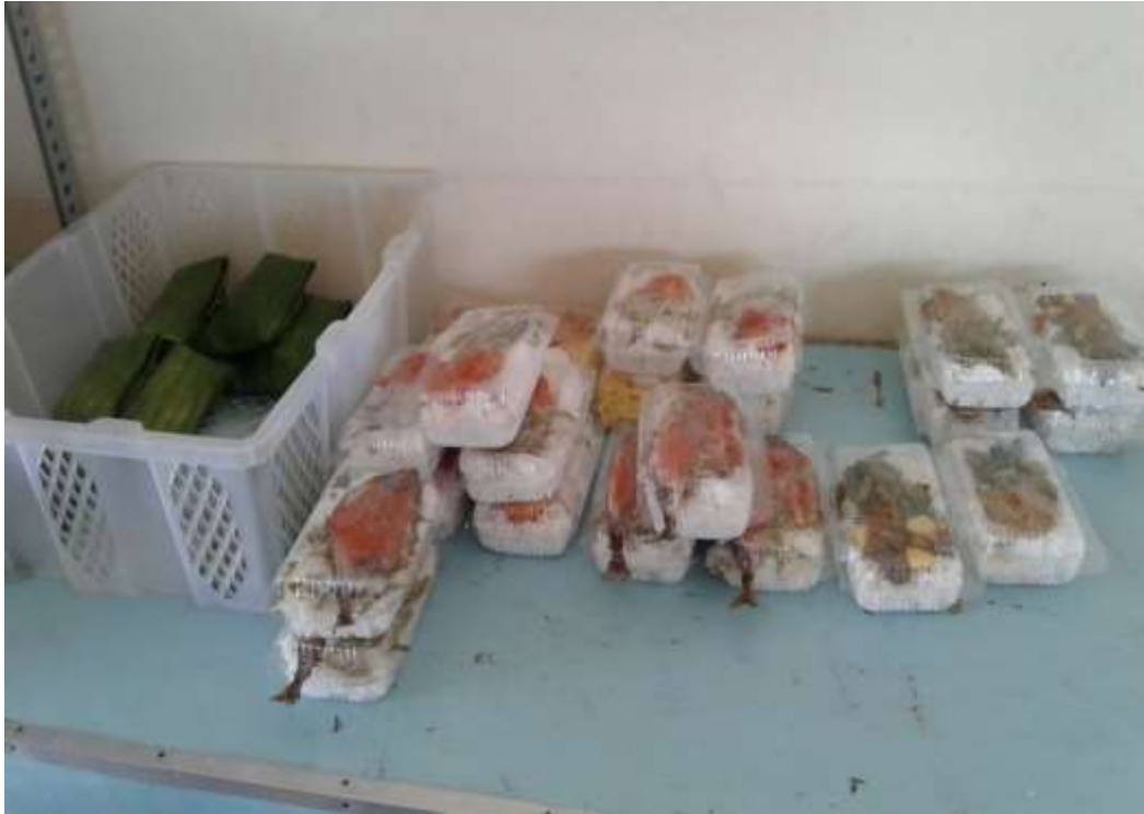
Gambar 14. Makanan yang di Pasarkan di KUD Indah Jaya