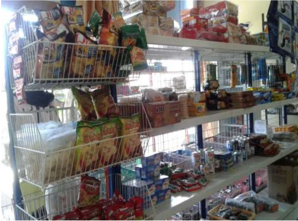
Gambar 18. Barang-barang yang di perjual belikan di KUD Indah Jaya