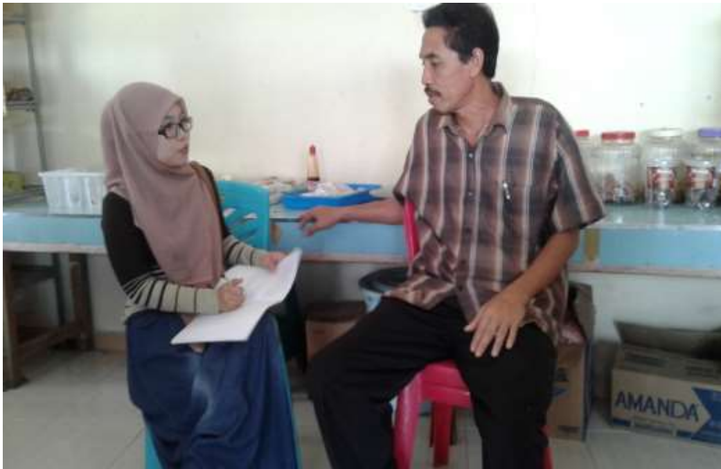
Gambar 2. Wawancara dengan Bendahara KUD Indah Jaya