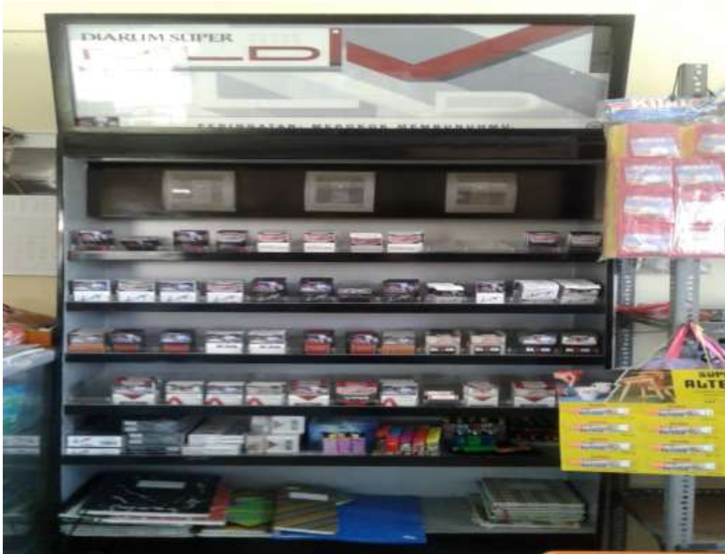
Gambar 20. Barang yang di Perjual belikan di KUD Indah Jaya