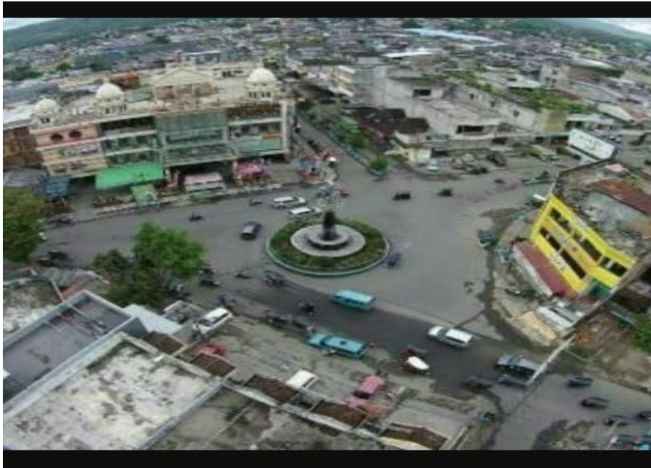
Gambar 11 Kondisi Kotamobagu