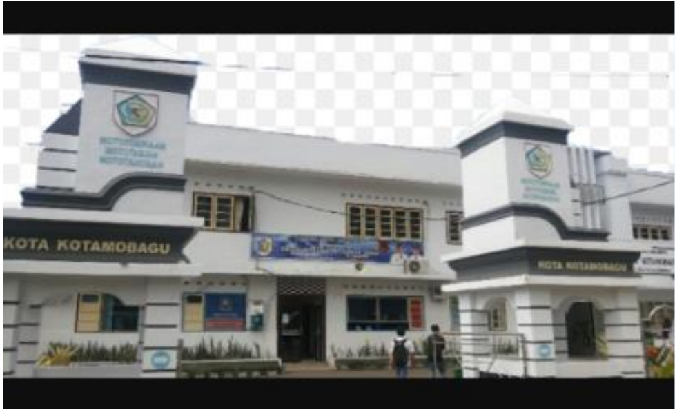
Gambar 13 Kantor Walikota Kotamobagu