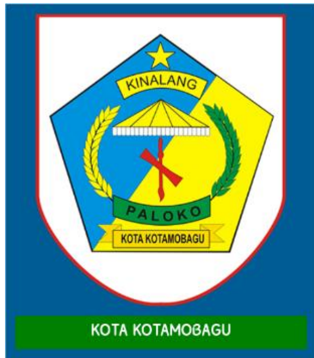
Gambar 4 Lambang Daerah Kota Kotamobagu

Pemerintah Walikota pertama sampai ketiga