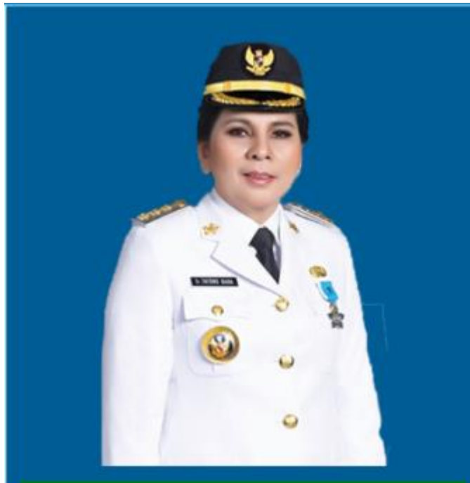
Gambar 7 Ibu Ir. Hj. Tatong Bara ( Walikota ketiga)