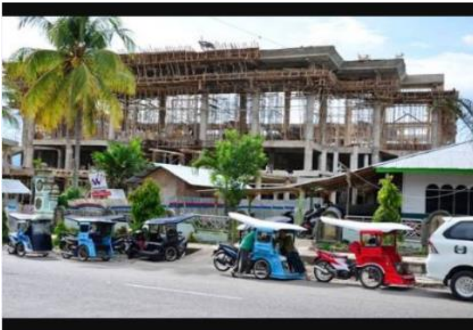
Gambar 12 Kondisi Pembangunan di Kotamobagu