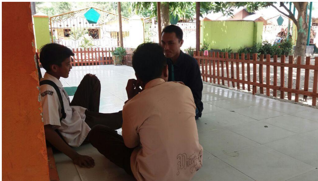
Wawancara bersama siswa