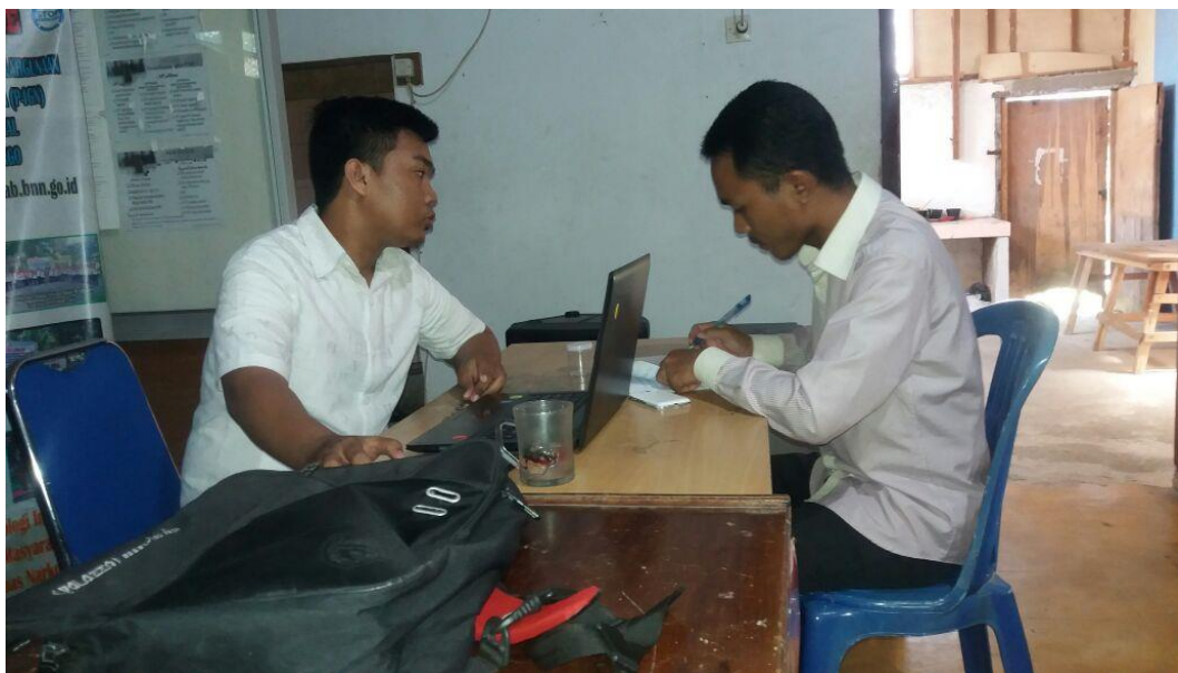
Wawancara bersama Bapak Farul