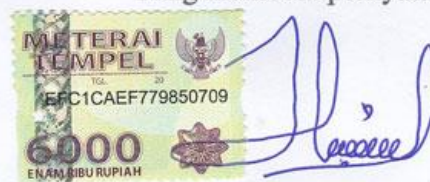
Hardianti Z. Podungge

Gorontalo, Desember 2017 Yang membuat pernyataan