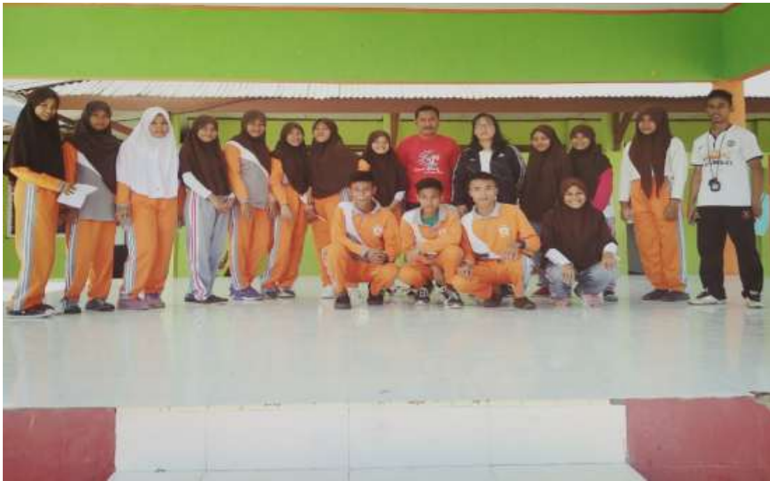
FOTO BERSAMA GURU PAMONG