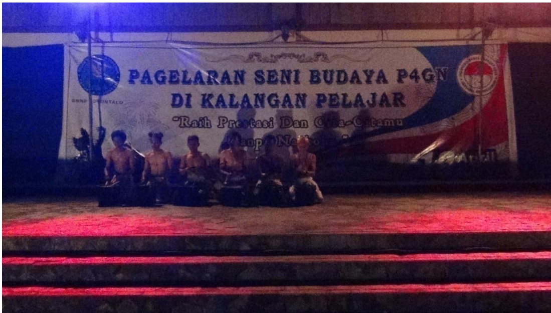
Pagelaran seni budaya P4GN di Kalangan Pelajar (Bagian dayamas 19 April 2014).