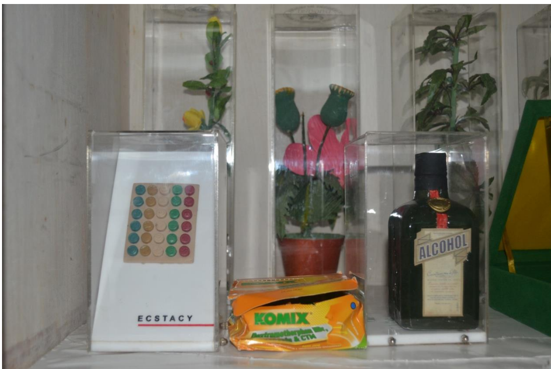
Alat yang di gunakan saat melakukan penyuluhan di sekolah. ( bagian dayamas 2017)