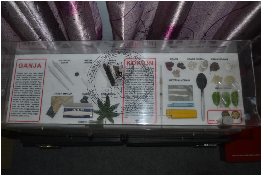
Alat yang di gunakan saat melakukan penyuluhan di sekolah. ( bagian dayamas 2017)