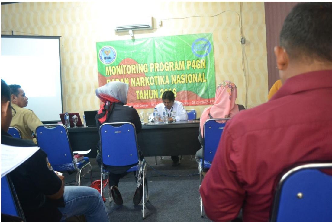
Monitoring Program P4gn Bnn ( Dayamas Tahun 2016)