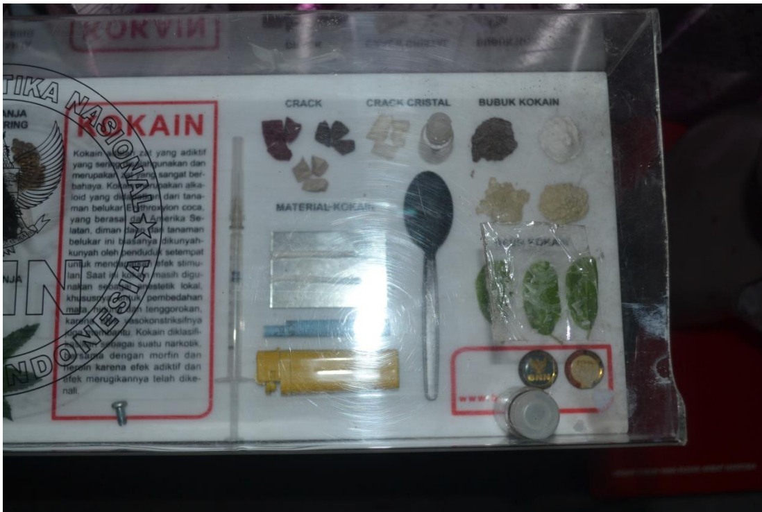
Alat yang di gunakan saat melakukan penyuluhan di sekolah. ( bagian dayamas 2017)