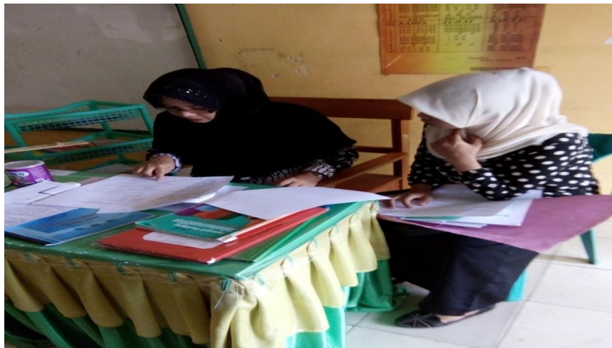
Konsultasi RPP pada Guru Mitra