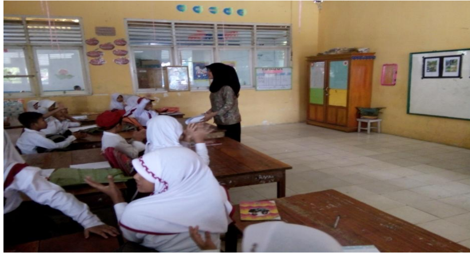
Memberikan Materi Pembelajaran