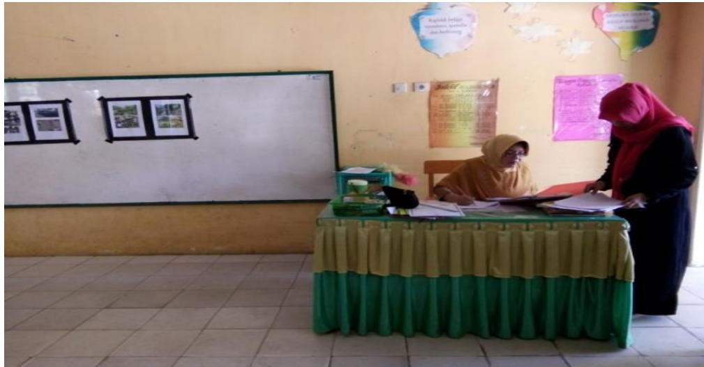
Mengkonfirmasi Teks Wacana Pada Guru Mitra