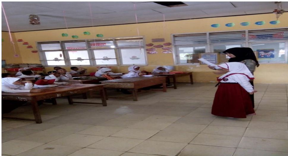
Memberikan kesempatan pada siswa untuk membaca wacana di depan