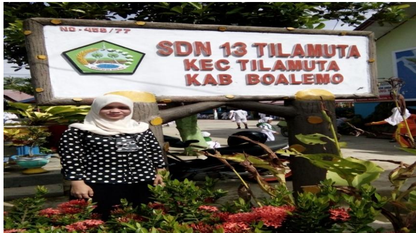
Profil SDN 13 Tilamuta Kecamatan Tilamuta Kab Boalemo