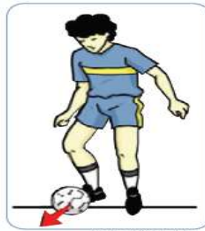
Menggiring bola dengan kaki bagian dalam