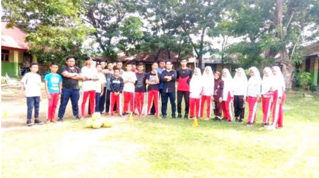
Foto bersama siswa