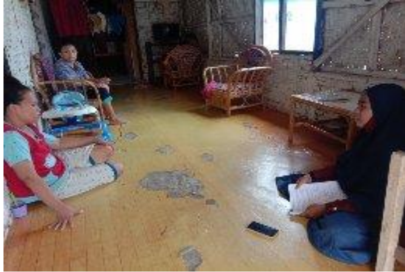
Gambar 1. Proses wawancara kepada Alin Yunus yang memiliki tingkat pendidikan putus SMP dan berprofesi sebagai penjual kue keliling di Desa Tinelo Kecamatan Tilango Kabupaten Gorontalo.